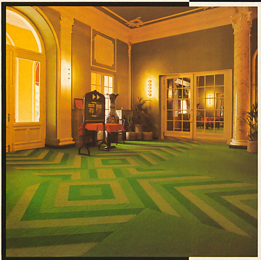
Reinwollbouclé/ Bouclé pure laine/ Pure wool bouclé/ Bouclé di pura lana

Mit dem neugeschaffenen Slogan «Renovieren statt demolieren» werden die Architekten heute immer mehr mit sehr unterschiedlichen Aufgaben betraut, die von ihnen oft viel Einfühlungsvermögen in den Baustil früherer Epochen verlangen. Gerade wenn es darum geht, alte, öffentliche Gebäude, Hotels oder ähnliche Objekte umzubauen oder deren Innen-