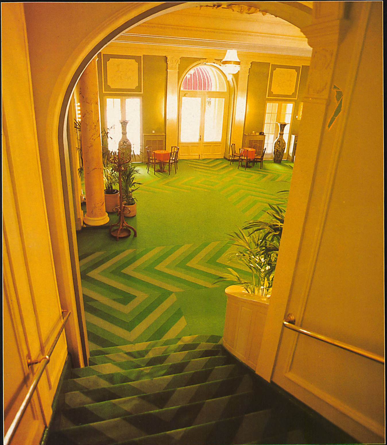
Reinwollbouclé / Bouclé pure laine / Pure wool bouclé / Bouclé di pura lana