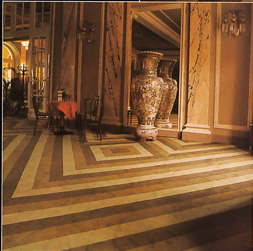
« Golden Wilton », reine Schurwolle (Wollsiegel-Qualität) / pure laine vierge (qualité Woolmark) / pure new wool (Wool- mark quality) / pura lana vergine (qualità marchio lana)