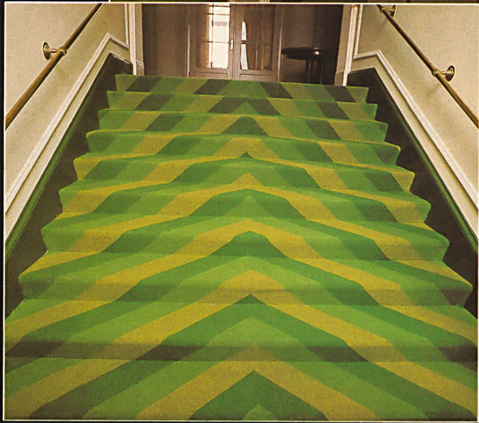
Reinwollbouclé / Bouclé pure laine / Pure wool bouclé / Bouclé di pura lana