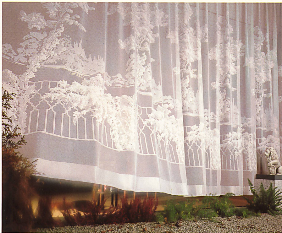
Ausbrenner-Voile, Polyester/Viscose / Voile polyester/viscose à dessins en technique de carbonisation / Burnt-out voile, polyester/viscose / Velo per corrosione, poliestere/viscosa (Art. 51.415, h = 280 cm).