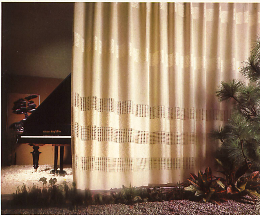
Dreherbordüre, Acryl / Bordure gaze en fibre acrylique / Gauze edging, acryl / Bordatura di garza, acrole (Art. 51.750, h = 270 cm).