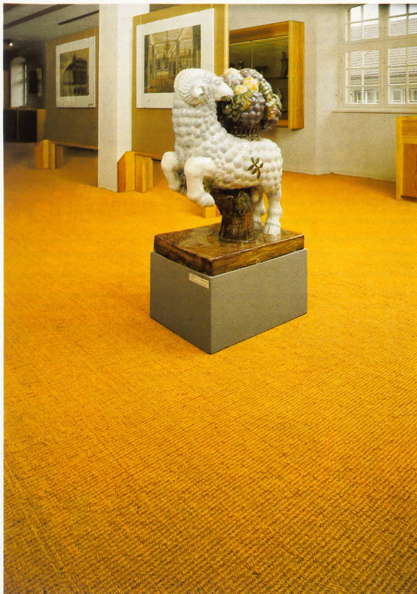
RAG CALICUT EXTRA