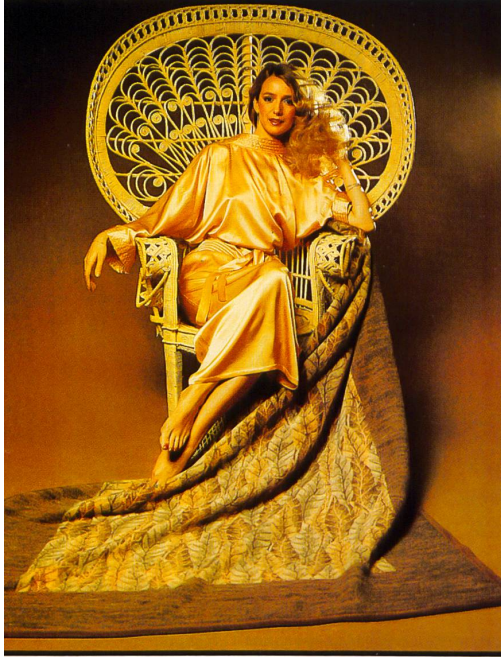
TAMARA « Herbstlaub ».

Mais la fibre acrylique de marque Orlon® est aussi utilisée pour une autre série de couvertures dont les dessins et les jeux de couleurs correspondent à un nouveau sentiment du confort de l'habitat. La belle surface, qui conserve son aspect distingué même après plusieurs lavages, a un air naturel et est très facile à entretenir. Eskimo Textil SA lance divers thèmes de dessins sous les noms de « Tamara », « Eveline » et « Caroline » qui mettent à la disposition des amateurs des sujets romantiques, classiques, naturels, de style « broderie », floraux ainsi que des rayures originales. Pour le rendu des dessins ce sont le grand savoir-faire pratique des tisseurs en jacquard et le finissage très poussé qui assurent à ces couvertures un aspect toujours égal. La tendance aux dessins élégants et aux subtiles combinaisons de coloris trouve son compte avec les nouvelles couvertures de divans, de jour et de nuit.