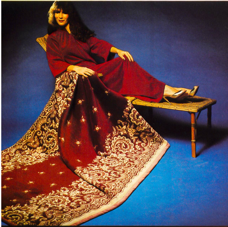
TAMARA « Romantica ».