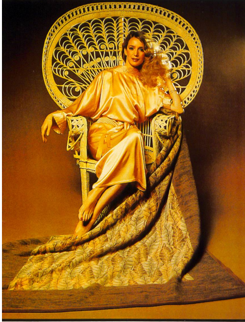
TAMARA « Herbstlaub ».

Mais la fibre acrylique de marque Orlon® est aussi utilisée pour une autre série de couvertures dont les dessins et les jeux de couleurs correspondent à un nouveau sentiment du confort de l'habitat. La belle surface, qui conserve son aspect distingué même après plusieurs lavages, a un air naturel et est très facile à entretenir. Eskimo Textil SA lance divers thèmes de dessins sous les noms de « Tamara », « Eveline » et « Caroline » qui mettent à la disposition des amateurs des sujets romantiques, classiques, naturels, de style « broderie », floraux ainsi que des rayures originales. Pour le rendu des dessins ce sont le grand savoir-faire pratique des tisseurs en jacquard et le finissage très poussé qui assurent à ces couvertures un aspect toujours égal. La tendance aux dessins élégants et aux subtiles combinaisons de coloris trouve son compte avec les nouvelles couvertures de divans, de jour et de nuit.