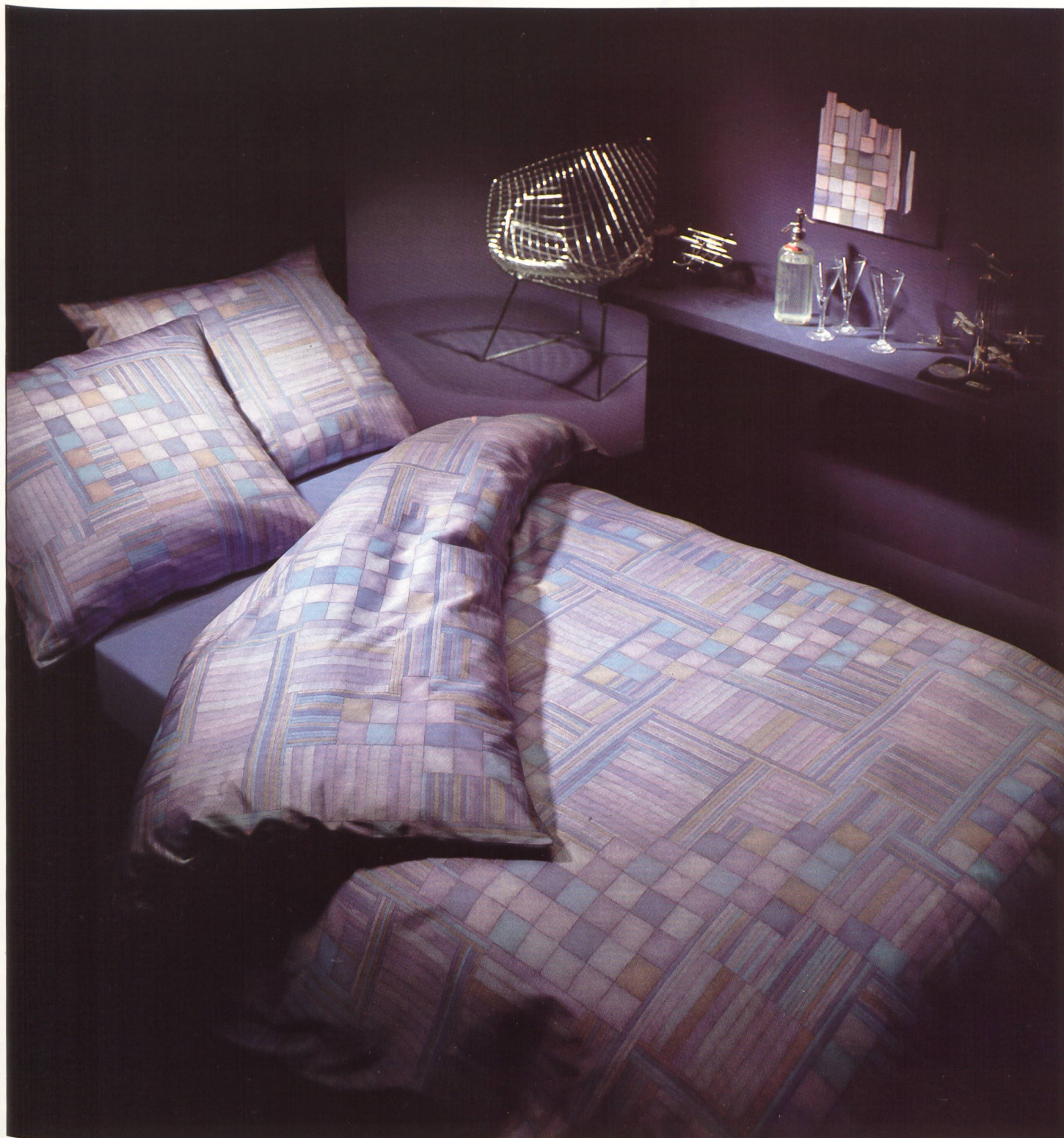
«Sandal» Druckdessin auf Baumwoll-Jersey Royal / Dessin imprimé «Sandal» sur jersey coton Royal / "Sandal" print design on Royal cotton-jersey / «Sandal» disegno stampato su jersey Royal in cotone.