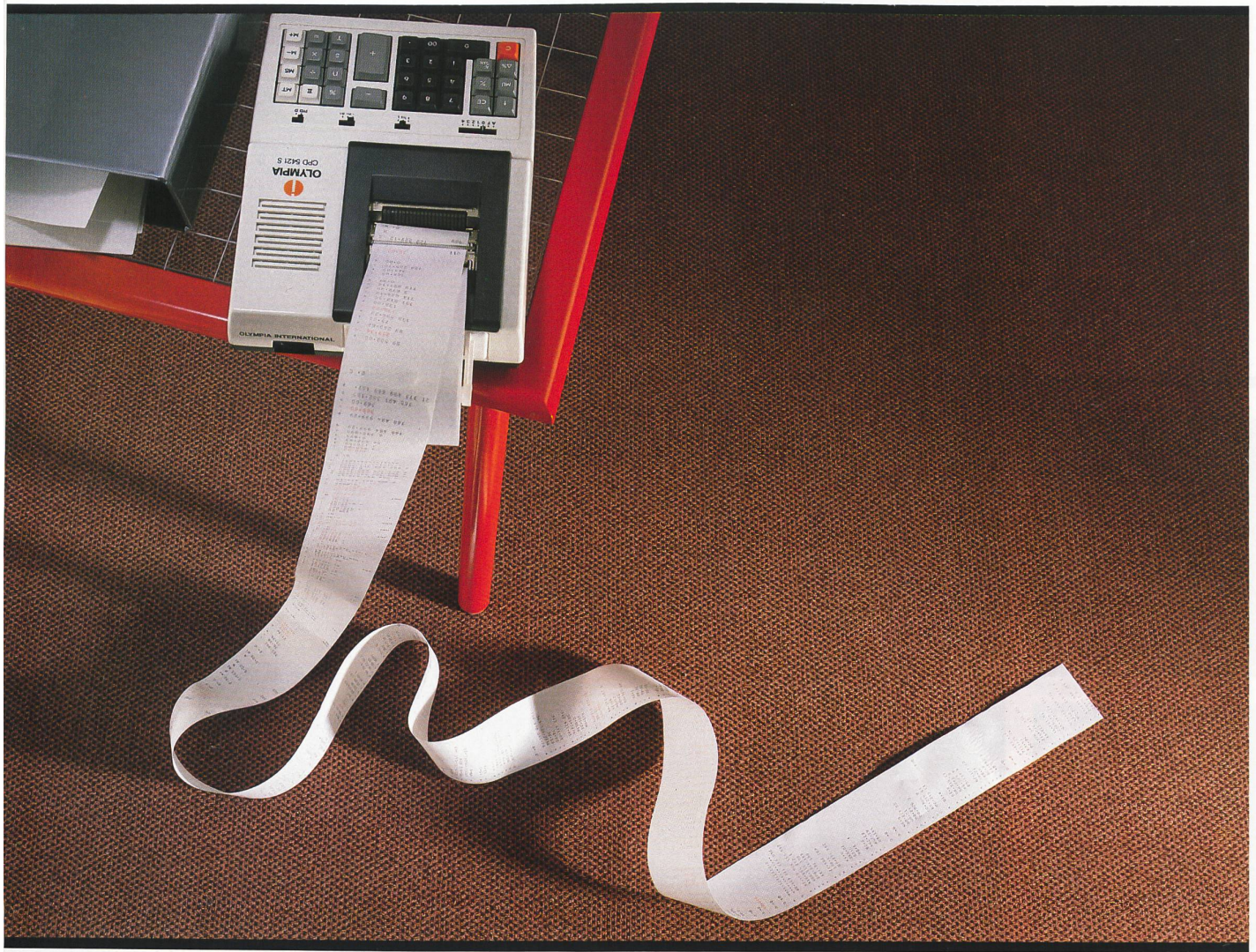
TIARA Domino, getufteter Velours, 100% Polyamid Antron-Plus; Poleinsatzgewicht ca. 760 g/m 2 ; Breite ca. 420 cm; Eignungsbereich: starke Beanspruchung; rollstuhl-, treppen- und bodenheizungsgeeignet. Rücken: textiler Zweitrücken TIARA-Textbac.