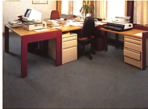
Kantonalbank Herisau Dessin 452