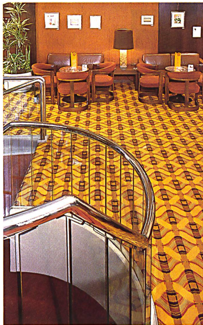
Hotel Hilton, Basel Dessin 729