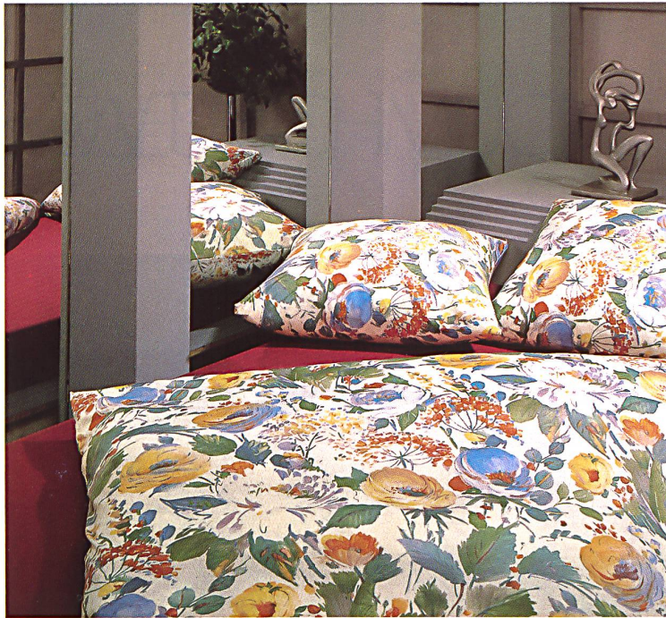
«Sinfonia» auf Jersey Royal, ein romantisches Blumenmuster, erhältlich in Jaune, Bois de Rose und Aqua.

Wie schon erwähnt, sind die Farbtonwerte leicht angehoben, die Kontraste lebhafter, das Farbspiel breiter geworden. Manchmal unterstreicht ein Weissfond die gewünschten Effekte. Abricot ist ein neues Kolorit im Bettwäsche-Sektor, das sich gut in die Gamme von Bois de Rose, Aqua, Cannelle, Sable, Argent, Palmier und Lavande einfügt.