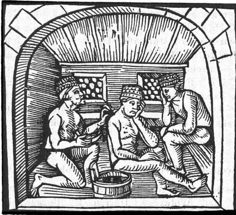
Badstube aus einem Kalender von 1515. Basel, Pamphilus Gengenbach. Darstellung des Schröpfens. Alle drei Personen tragen die aus Stroh verfertigten Badehüte.

rechnen, dass die Produkte der Freiämterstrohflechter damals schon qualitativ und preislich den Strohhüten, wie sie in Zürich selbst und auf dem Rafzerfeld hergestellt wurden, überlegen waren. Schon die uns bekannten Aufzeichnungen im