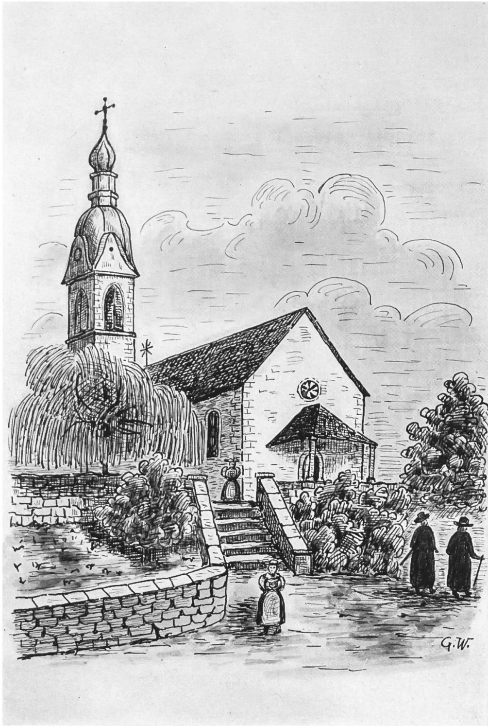
Die Kirche vor dem Abbruch