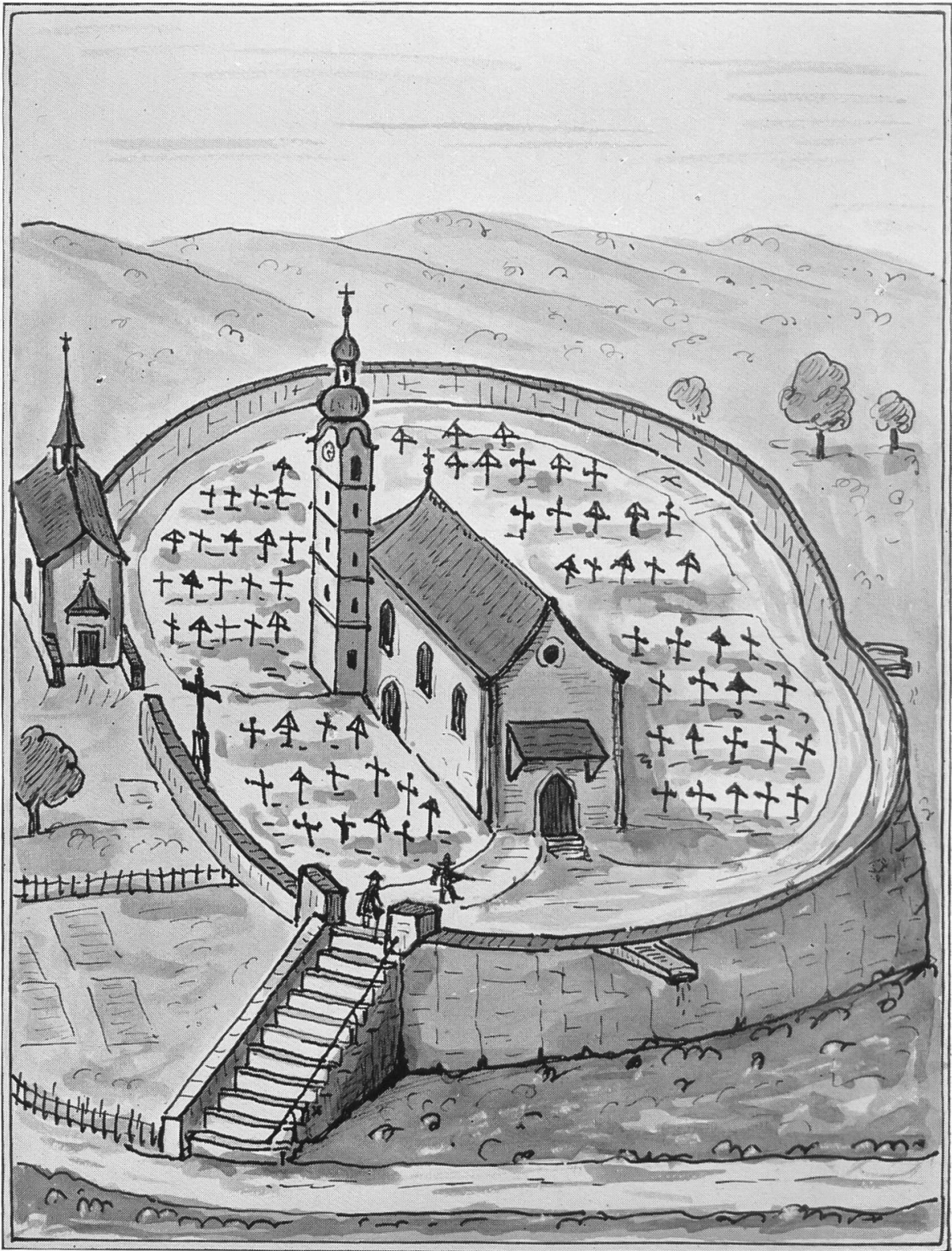
Kirche von 1620