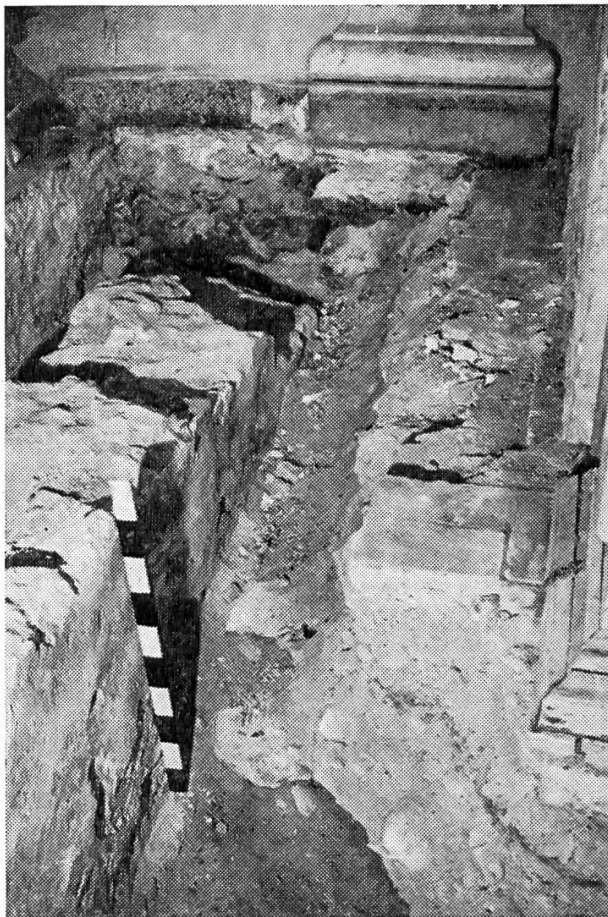
Die noch bis 90 cm Höhe erhaltene Westmauer der gotischen Sakristei