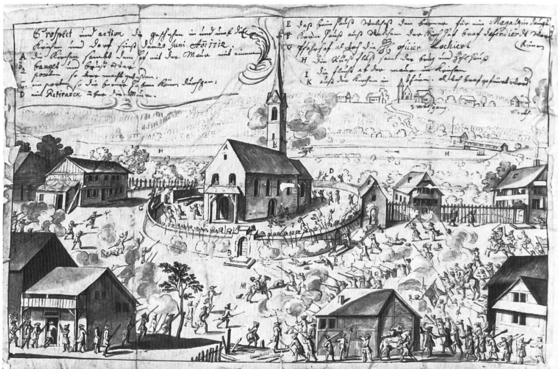
Zeichnung von Johann Franz Strickler über das Gefecht von Sins am 20. Juli 1712. Nähere Angaben s. Anm. 33 und 34.

Der Vollständigkeit halber sei aber noch darauf hingewiesen, dass sich die Zurlauben in diesem Bürgerkrieg von 1712 nicht durch ausserge-