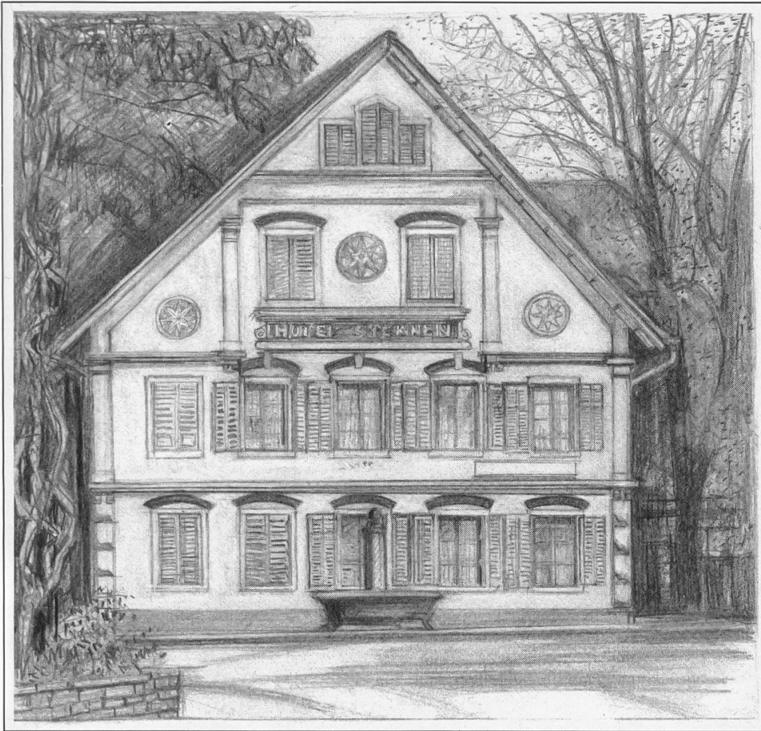
Gasthaus «Sternen» in Wohlen, das Heinrich Fischer am 5. Dezember 1830 als Hauptquartier bezog.

wirkungen» einer Aktion, die Gewalt anwendet, hingewiesen: Roheiten gegenüber der Bevölkerung, Ausschreitungen jeder Art einer unkontrollierten und ungeordneten Masse.