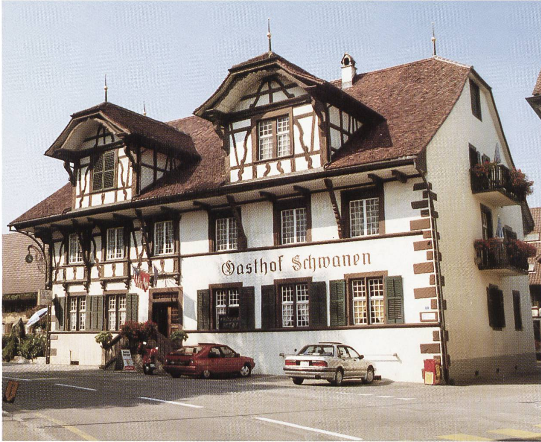
Gasthof zum Schwanen, Merenschwand.