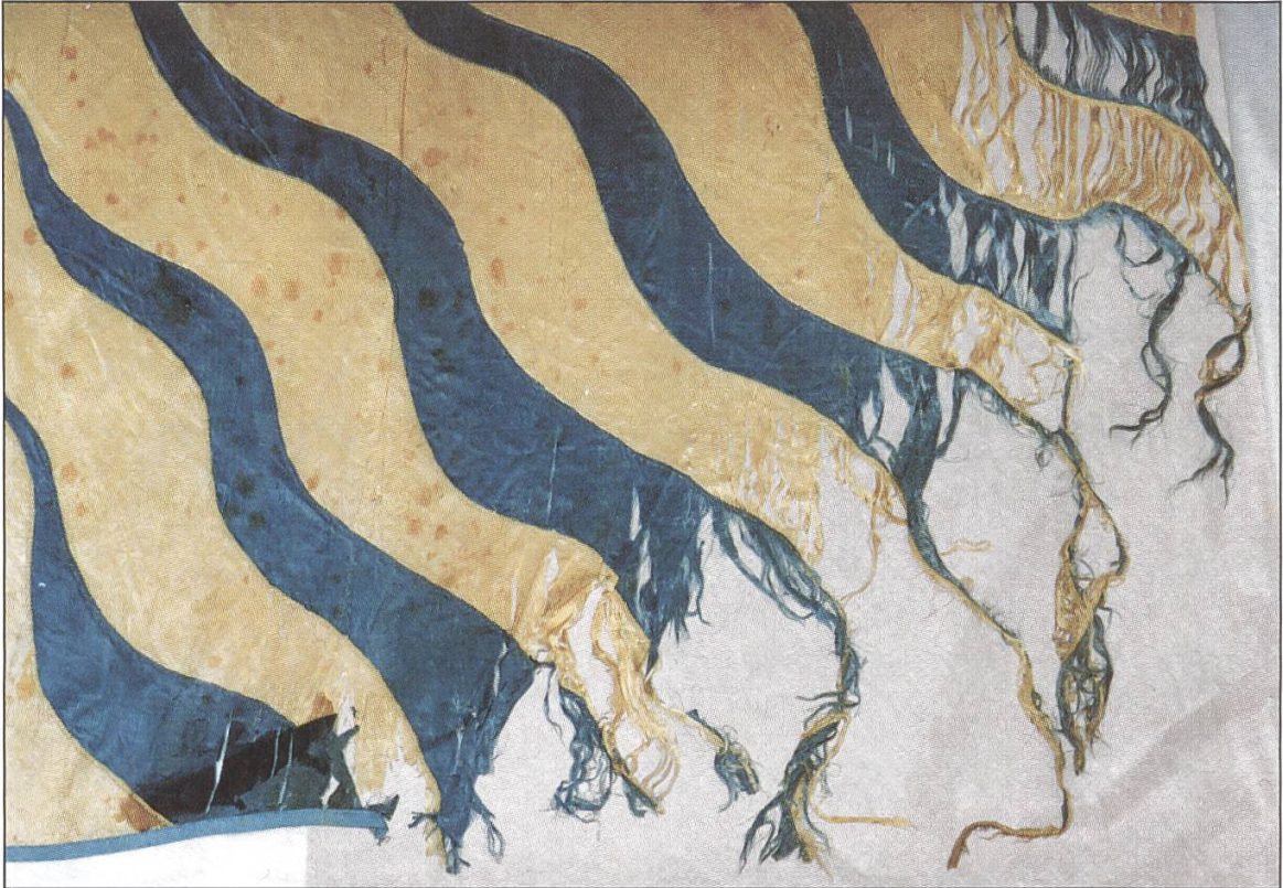
5 Untere rechte Ecke vor Restaurierung...