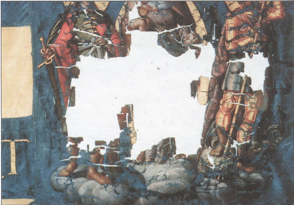
8 Gleicher Ausschnitt nach Entfernen der unterlegten Stoffe und Handstiche