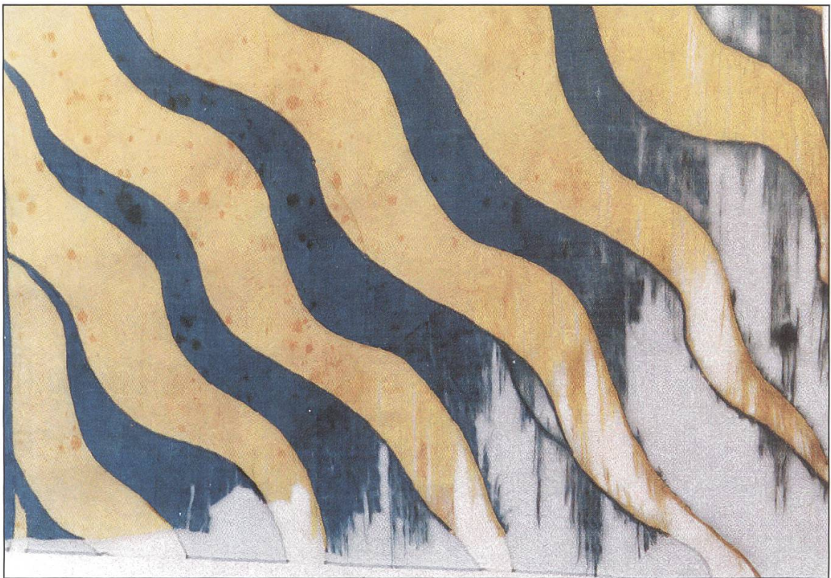
6 Nach Restaurierung, mit Seidengaze unterlegt