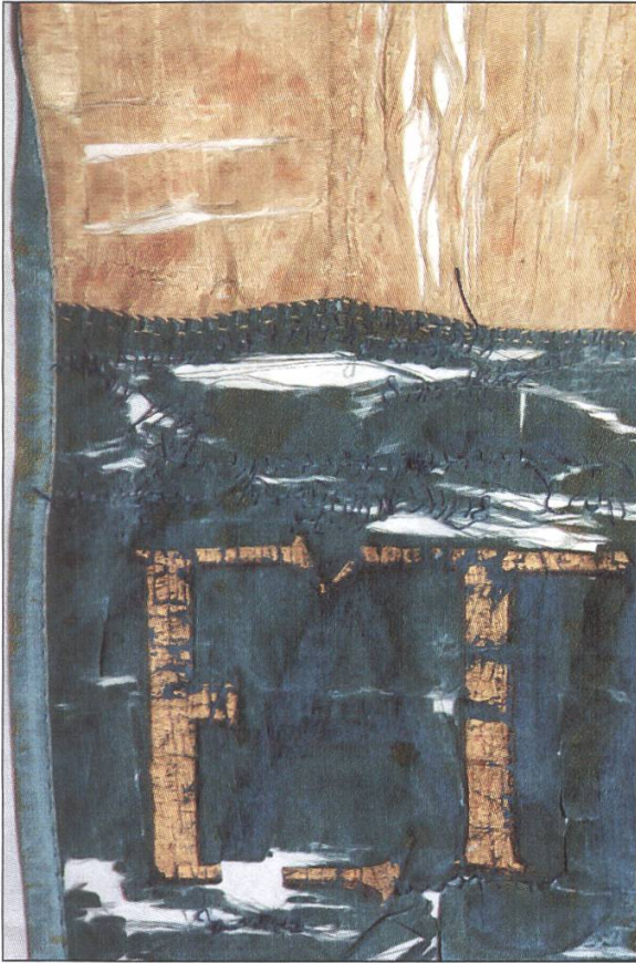
3 Detail mit Handstichen und Einfassbändchen vor Restaurierung...