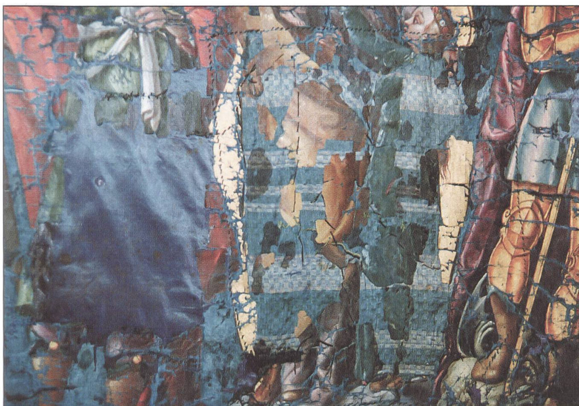
7 Medaillon vor Restaurierung mit alten unterlegten Stoffstücken und Handstichen