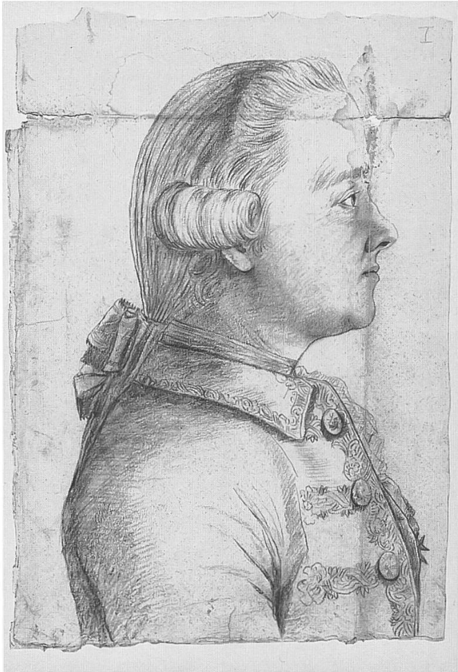
Beat Fidel Zurlauben (1720–1799), Porträt.