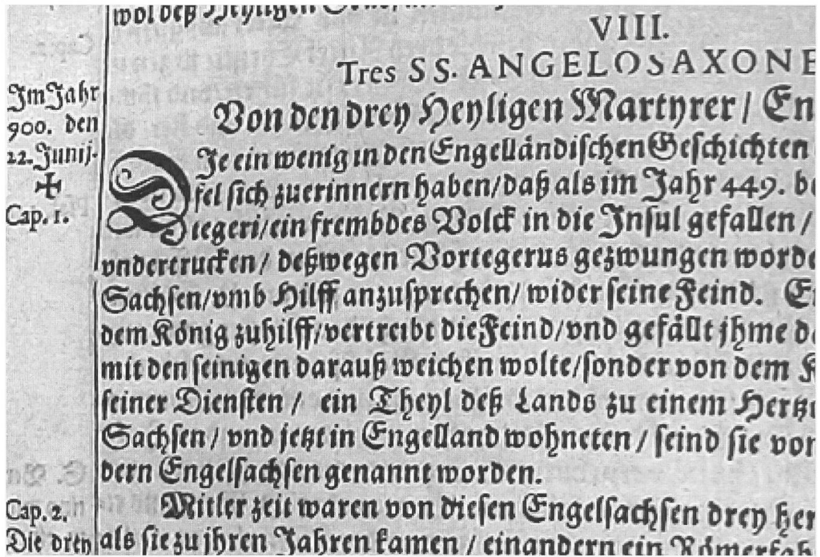
Die Angelsachsen-Erzählung von P. Heinrich Murer (Ausschnitt).

H. Engelsachsen von Alters hero genant worden) zogen auß jhrem Vatterland vber Meer in Teutschland / vmb das 900. Jahr vngefährlich (dann kein gewisse Jahrzahl gefunden wird.) Vnd wie sie nun durch das Teutschland herauff reyseten / vnd in das Ergöw kamen / in den Flecken Sarmenstorff / war eben da ein Hochzeit gehalten / vnnd als in der Kirchen die Meß vnd Predig vollendet / vnd beyde neue Ehe-menschen zusammen geben worden / giengen sie mit jhren Ehrengästen an ein ehrliche Mahlzeit / zu welcher auß Freundlichkeit der Innwohner diese drey Engelsachsen / als frembde Bilger auch geladen vnnd beruffen worden. Nach vollendter Mahlzeit wolten die drey Engelsachsen neben freundlicher Dancksagung der bewißnen Ehren die Gutthat auch vergelten / vnnd vergabten den neuen Eheleuthen samptlich an einem stuck einen Rheinischen Gulden / oder dergleichen stuck Gelts / daß sie noch allein in jhrem Seckel hatten / vnd folgendts das heylig Allmosen suchen müßten / damit namen sie ein freundlichen Vrlaub und zogen darvon.