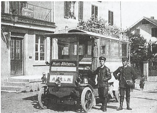
Postauto Muri-Affoltern, 1906, vor der alten Post in Muri (Marktstrasse)

Eine tägliche Postverbindung vermittelte nun den Verkehr zwischen Muri, Affoltern und Zürich. Muri war dadurch sehr günstig gestellt, wollte aber, um den Verkehr zu heben, dass diese für die damaligen Bedürfnisse so günstigen Verkehrsverhältnisse auch den Gemeinden des Lindenberg und des Seetals zuteilwerden. Es wurde eine günstige, den modernen Anforderungen an eine Strassenanlage entsprechende Verbindung über den Lindenberg ins Seetal angestrebt. Die aargauische Regierung kam diesen Wünschen entgegen und sandte den Ingenieur Preyhener (und Schmid), der eine neue Strassenanlage ausarbeitete. Dieser Entwurf, der aber den Bedürfnissen der Nachbargemeinden kaum entsprochen hätte, liegt in den Archiven der Bau- direktion.