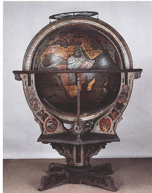
Abb. 3: Der St. Galler Globus stammt aus der zweiten Hälfte des 16. Jahrhunderts und steht heute im Schweizerischen Nationalmuseum in Zürich. Er gehört zu den Kulturgütern, die 1712 aus St. Gallen verschleppt wurden. Erst 2006 konnte der Besitzerstreit gelöst werden: Eine Kopie steht nun in der Stiftsbibliothek St. Gallen (Schweizerisches Nationalmuseum, Dep-846).