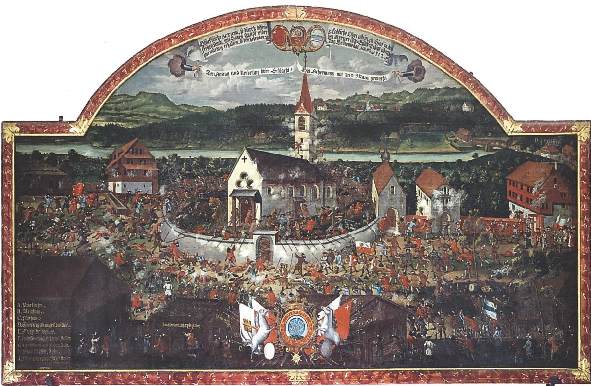
Abb. 1: Die Schlacht bei Sins. Ölgemälde von Johann Franz Strickler aus Zug, 1713, in der Loretokapelle Ennerberg bei Buochs in Nidwalden. Siehe Text S. 162 f.

kularen Nationenbildes gefördert. 9 Auf katholischer Seite blieb die Konfession jedoch wichtigster kollektiver Bezugspunkt. 10 Zu zahlreich erwiesen sich die Konfliktpunkte entlang der konfessionellen Grenzen, als dass sie sich durch eine Art säkulare Mythologie hätten neutralisieren lassen. 11 Die Reformierten hatten das Kräfteverhältnis in der Eidgenossenschaft nach 1712 zu ihren Gunsten verschoben und konnten damit ohne grosse Rücksicht auf ihre katholischen Nachbarn agieren. Sie waren es auch, die den Diskurs über das Selbstbild der Eidgenossenschaft, den Nationendiskurs, bestimmten. Dabei spielten Erinnerungsorte und Riten jedoch kaum eine Rolle.