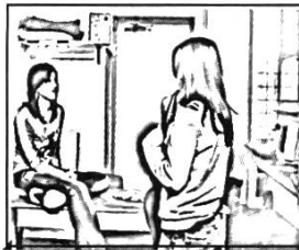
#3: 3'27''05 1. °michelle?°