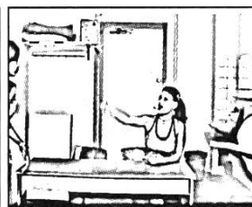
#2: 06'38''22 11. LOR: AS