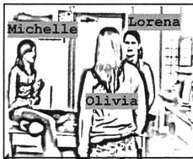
#1: 03'25''23 1. OLI: EST-CE QUE