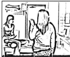
#2: 03'26''12 1. tu as <fait: