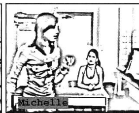
#3: 06'39''20 12. MIC: °ok tu as°

Lorena utilise en effet une formulation métalinguistique (plutôt que de fournir une formulation alternative, comme à la l. 3) dans un énoncé normatif en suisse-allemand ("du muesch sage vergangeheit", tu dois dire le passé ) suivi de la forme française en question ("tu AS"). Le tour de Lorena, qui est produit