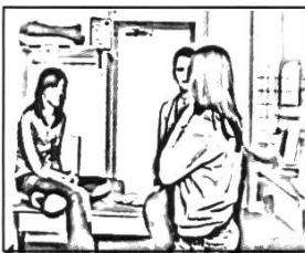
#4: 03'29''05 2. mic ((regard et mouvement de la tête))