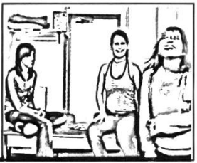
#5: 03'30''15 5. oli ((se détourne brusquement et rit)) lor ((rit))

Dans ce premier extrait, le repérage du problème et sa correction ne se déroulent pas uniquement sur le plan verbal, mais plutôt sur un plan interactionnel plus large, marqué par la répétition d'un même segment (l. 1), le rythme et la prosodie (ralentissement, allongement syllabique, voix moins forte, l. 1), les gestes et les regards (ll. 1, 2) et la pause (l. 2). En effet, le premier tour d'Olivia (une première partie de paire adjacente 10 ) est auto-catégorisé comme potentiellement problématique, mais il l'est aussi rétrospectivement par les interlocutrices qui rendent visible leur interprétation par leurs réactions. Sur le plan verbal, il y a absence de réaction avec la pause de la ligne 2, mais celle-ci est bien remplie sur le plan mimo-gestuel: Michelle qui continue à regarder Olivia, change la position de sa tête en la penchant légèrement sur le côté tout en affichant une mimique de désapprobation lorsqu'elle répète à voix basse les derniers mots d'Olivia (l. 4). Ce repérage multimodal du repairable donne lieu à une hétéro-correction de la