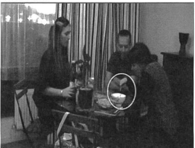
5. JUL pointe vers le bol et demande ce que c'est