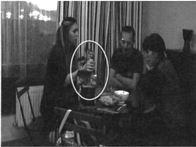
3. ANN saisit le goulot de la bouteille