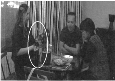
1. ANN saisit la bouteille et touche le bouchon