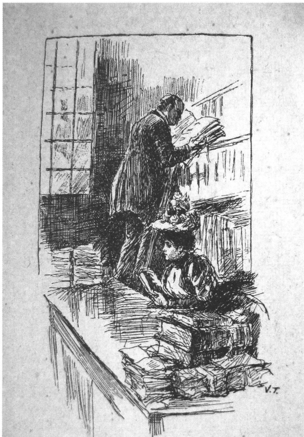
Fig. 2: incisione di Turati nella raccolta Dal primo all'ultimo amore