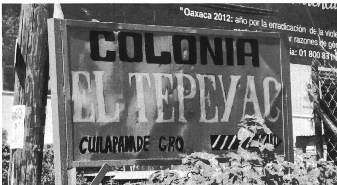
Figura 2: Letrero colonia Tepeyac, Oaxaca

El siguiente letrero también es portador de un topónimo azteca e indica el lugar de una colonia reciente en la periferia de la ciudad con nombre El Tepeyac .