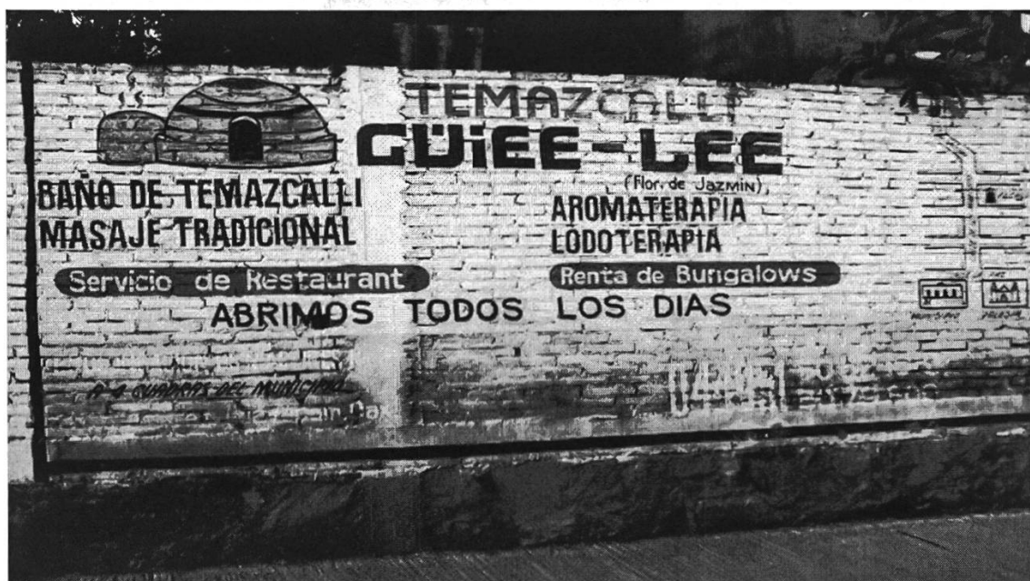
Figura 4: Letrero indicador de un baño temazcal en Huayapam, Oaxaca

El rótulo llama la atención por varios aspectos, entre los cuales destaca el uso de las diferentes lenguas español, inglés, náhuatl y zapoteco, la selección de los colores nacionales mexicanos, blanco, verde y rojo, la combinación entre letras, pictograma y, al lado extremo derecho, el croquis de un mapa que hace alusión al tipo de texto colonial de los códices. La visibilidad del náhuatl se muestra en el uso de la palabra para denominar el baño de vapor de tradición azteca, temazcalli , ‘casa de baño’ en vez de usar el término adaptado al español que forma parte del léxico del español mexicano, temazcal . El zapoteco se presenta en la palabra compuesta güiee-lee , cuya traducción se encuentra abajo de ella entre paréntesis, flor de Jazmín . Se encuentran otras palabras en español, tales como masaje tradicional , aromaterapia , lodoterapia , los sintagmas abrimos todos los días , a 4 cuadras del municipio , portadores de información adicional. Por fin, se observa el uso del inglés en las palabras restaurant (en vez del término en español, restaurante ) y bungalow . Juntas, las características componen un texto complejo y polífono en el que están presentes tanto el emisor como el destinatario del mensaje: el uso del náhuatl y del zapoteco se puede adscribir a la voz del productor del texto, en el uso del español y del inglés se muestra el destinatario, es decir, el grupo de personas de habla