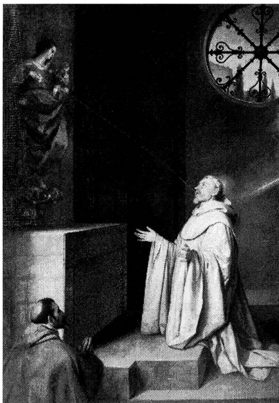
Alonso Cano, «San Bernardo y la Virgen»

siga con su marido, aun cuando una vez más le prometa que va a dejarlo. «De la mar el tiburón y de la tierra el varón», poco disimulado remedo de un dicho célebre en donde tiburón y varón sustituyen a mero y carnero , ¡y ojo a cómo iguala tiburón y varón !, es una historia de canibalismo sexual en la que una mujer disfruta con la carne masculina. Tras confesar su secreto y sus cuitas en una libreta, consigue encontrar por fin su media naranja. En «La loba», cuento que peca en mi opinión de rebuscado, un samaritano acompañado por una muchacha recorre el mundo, ahora en ruinas, una vez «la ciudad se vino abajo», dándole de mamar tanto a niños como a cachorros de animales, e incluso alimentándose él mismo de sus propios pechos 18 .