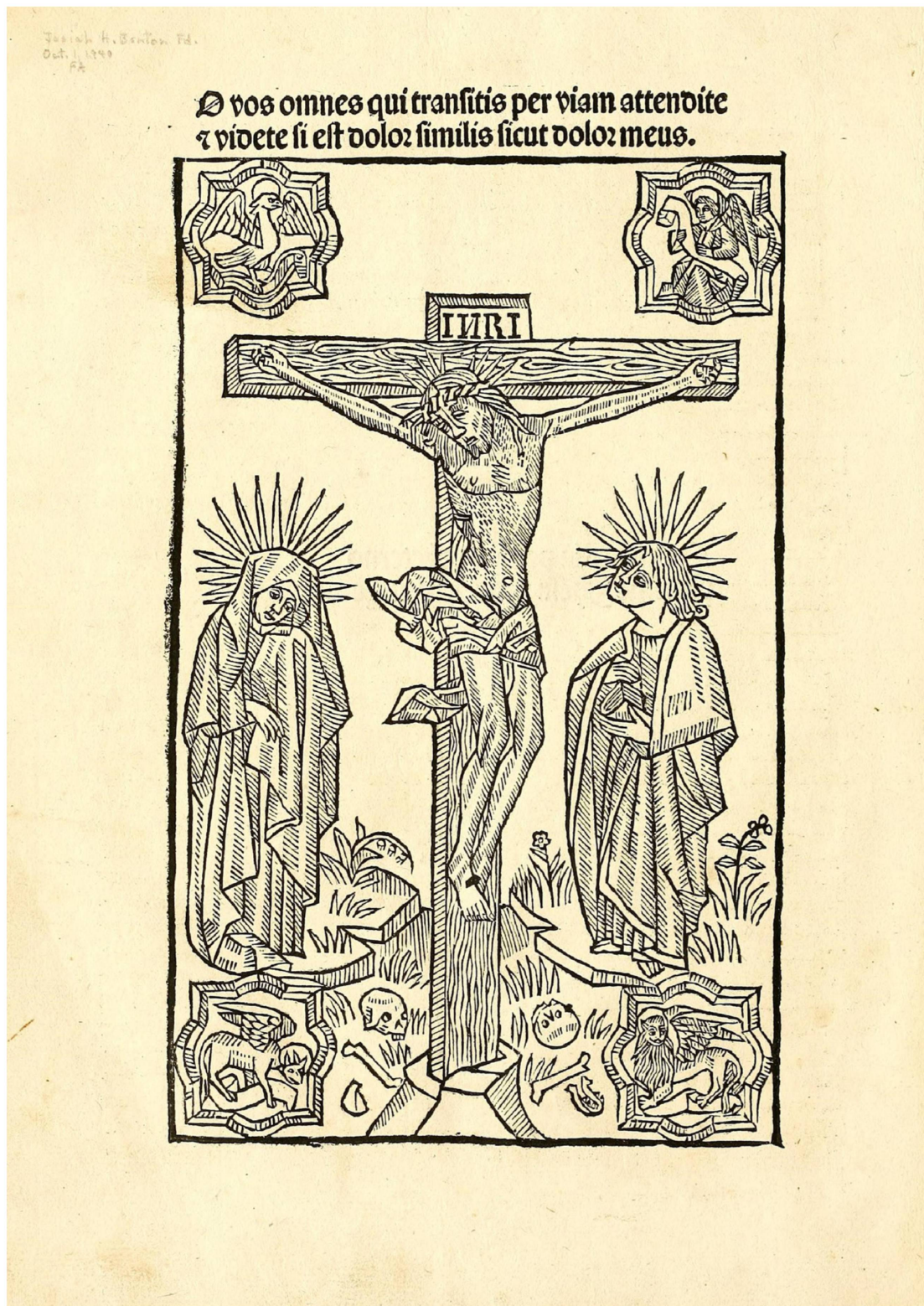
16. Preliminares a la Leyenda de los santos . Burgos, Fadrigue de Basilea, 1493 (?). Boston Public Library, Q.403.88, fol. Iv.