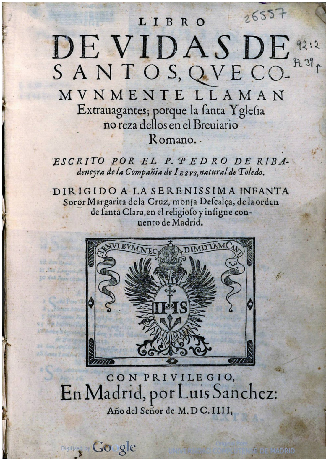
24. Pedro de Ribadeneira, Libro de vidas de santos, que comúnmente llaman Extravagantes , Madrid, Luis Sánchez, 1604, portada.