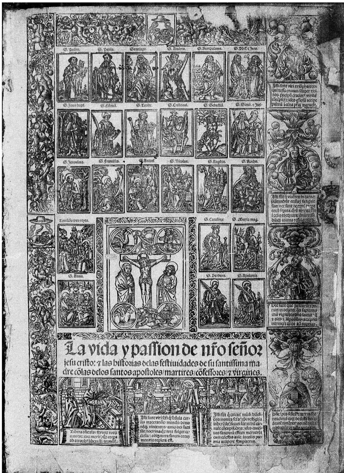
17. Flos sanctorum , Zaragoza, Jorge Cocci, 1516. Biblioteca Nacional de España (Madrid), R-23859, portada.