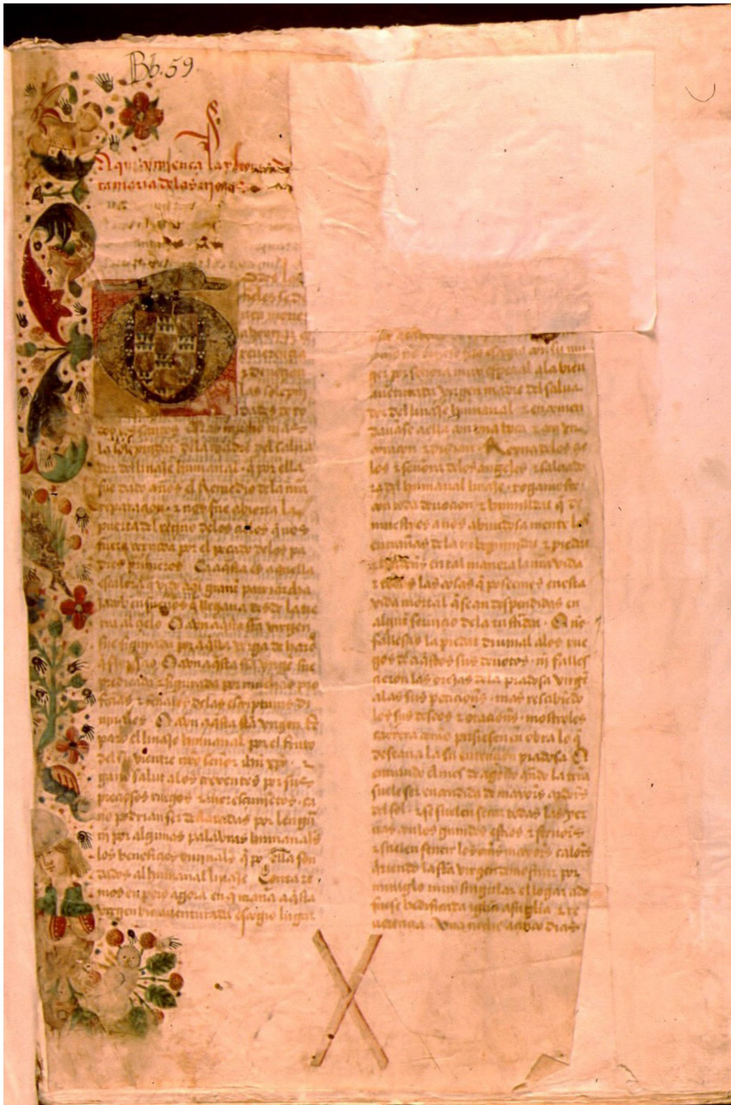
14. Flos sanctorum copiado para Pedro Fernández de Velasco, primer Conde de Haro. Ms. 12689 de la BNE, fol. 1r. Primera mitad del siglo xv.