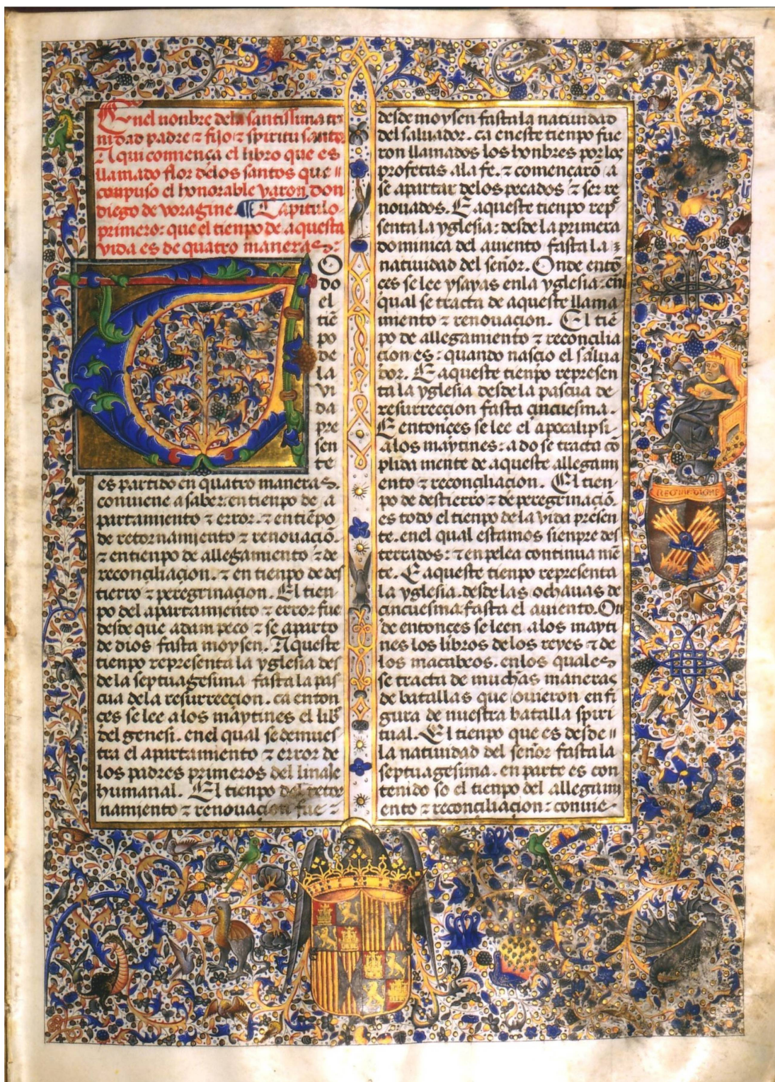
15. Flos sanctorum copiado para Isabel la Católica. Ms. h-II-18 de la Biblioteca de El Escorial, fol. 1r. Ca. 1488.