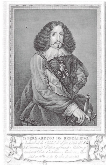
Retrato por Joaquín Ballester, 1791.

Las constantes se imponen tanto en el desarrollo de la iconografía del personaje, con muy ligeras variaciones, como en la disposición de la imagen, sancionando su valor canónico, como retrato «fidedigno» del poeta y como ejemplo de representación del aristócrata escritor.