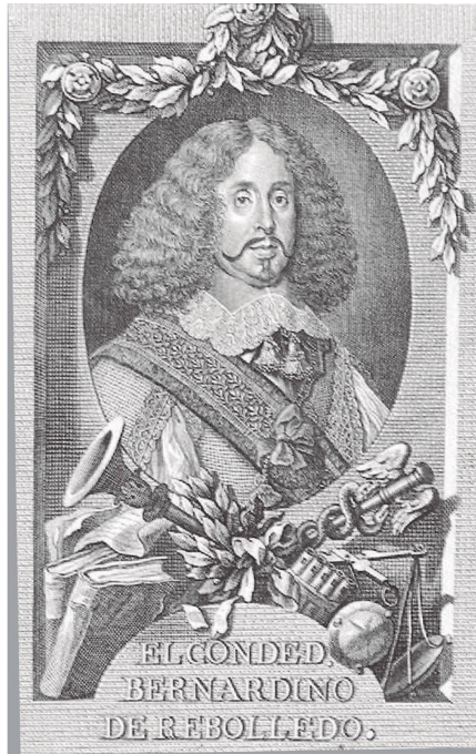
López de Sedano, Parnaso español , 1771.