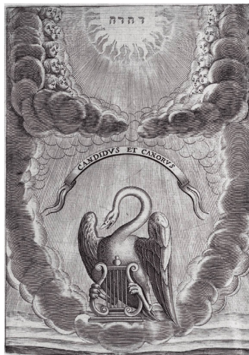
Selva sagrada , 1657.