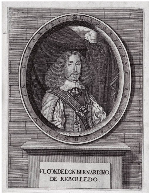
Idilio Sacro, 1660.