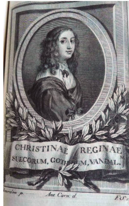
Selva sagrada , 1778.

Rebolledo publica en Colonia La constancia victoriosa , y dedica esta obra a Cristina, incluyendo un retrato de la reina, además del suyo propio. Al reeditar el conjunto de su producción poética mantiene la dedicatoria y el retrato de la reina, como ocurrirá en la edición de 1778, en este caso con distinta estampa. Los dos grabados ofrecen una representación parecida en sus rasgos esenciales, con el busto de la monarca en edad adulta, representada en tres cuartos, casi de perfil, aunque su cabeza se encuentra levemente girada, pero hacia lados distintos en cada representación.