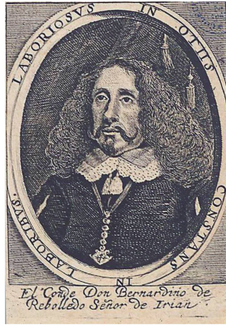
Selva militar, 1652.