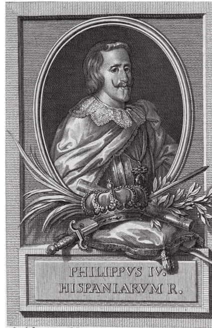
Rimas sacras , 1778.

Caso distinto, como a medio camino entre las dos relaciones anteriores, es el de las dedicatorias a la reina Sofía Amalia, reiterada en la reedición de las Selvas dánicas y sumada en la de Ocios . Aunque comparte algunos rasgos iconográficos con el retrato de Mariana de Austria en Idilio sacro (la orla en medallón, la pose, el peinado y las vestiduras lujosas), las diferencias son significativas.