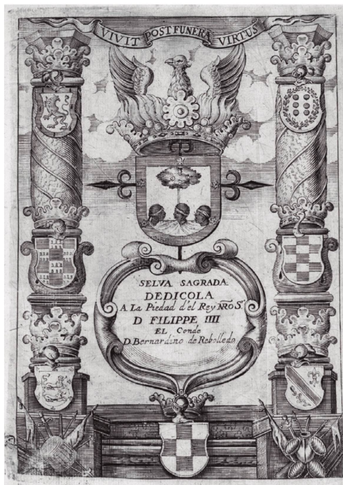
Selva sagrada , 1657.

del cisne de alas desplegadas extiende el aura de nobleza al escudo nobiliario de la portada y añade la alusión a la condición poética. En cambio, en las Rimas sacras , el tercer tomo de la reedición de las obras, encontramos un retrato del dedicatario. La representación de Felipe IV es sobria y austera. Su representación muestra más elementos de identidad con la del conde (atuendo, fondo de cortinas y ventana al exterior...) que diferencias. La similitud se refuerza en comparación con la imagen de la reedición dieciochesca. El rey aparece representado en un busto a tres cuartos, levemente girado, con gesto señorial. Sus ropajes y su porte denotan una imagen regia. Se trata de una representación prototípica, en la que el personaje se encuentra enmarcado en un medallón clásico que se encuentra ornamentado con diferentes elementos y atributos que aportan valor a su representación, como el medallón que aparece en su pecho, o la corona, la espada, el cojín y el catalejo en la parte baja del retrato, mostrando su categoría de rey y de hombre de armas. El dedicatario se encuentra enmarcado en la composición sobre un texto que lo identifica en su condición de soberano. En este caso, la relación difiere, y más que la de cercanía parece imponerse la imagen de distancia o de separación en los papeles que corresponden al poderoso y al escritor.