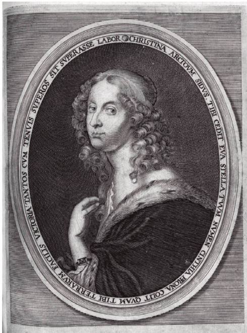
La constancia victoriosa , 1655.

de la reina. Fue el primer español en contactar con ella, tras las dudas religiosas que la invadían, y, aunque no llegaron a conocerse personalmente, ya que este nunca fue a Suecia a causa de sus enfermedades, mantuvieron correspondencia hasta la abdicación de Cristina 8 . Tal fue su contacto con la soberana, que esta le otorgó la insignia y banda de la Orden de Amaranta.