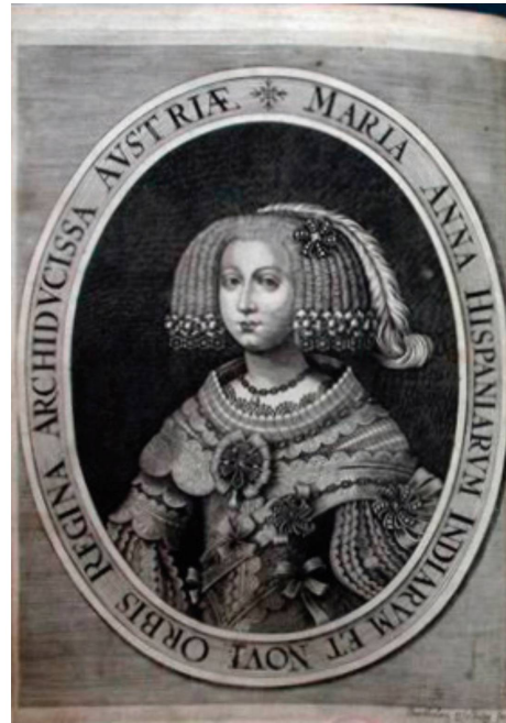
Idilio sacro , 1660.

El hieratismo de la monarca hispana se manifiesta en la rigidez y recato de su vestido, en el adorno del peinado y, sobre todo, en el gesto serio, con una mirada al espectador que traslada idea de dominio; en el fondo del retrato domina un color negro, sin otros elementos, con una sobriedad impuesta en la corte de los Austria desde Felipe II. En el retrato de la reina danesa, dentro de un esquema iconográfico repetido, la imagen se distancia: el vestido deja ver sensualmente los hombros y, junto a la sencillez (relativa) del peinado y la dulzura derivada de una mirada perdida, denota una imagen más cercana, entre la intimidad y la complicidad, acordes con la estancia de Rebolledo en el palacio de la reina. Sobre todo destaca el detalle del fondo del retrato: como a través de una cortina descorrida se deja ver un jardín, sustituyendo la sobriedad por la sensorialidad. En alusión a la silva descriptiva de la segunda parte de la obra, el grabado conecta el texto con el palacio de Hersholme, sinécdoque de la reina y asunto del texto. Así, mientras en la relación con los monarcas hispanos, el poeta se mantiene en una posición tradicional respecto al mecenas poderoso, sin distinción por la condición sexual de la figura regia, cuando se trata de ocupantes femeninas de tronos con los que no tiene relación de servidumbre el juego de comunicación se modifica y se manifiesta en el tratamiento de las representaciones icónicas.