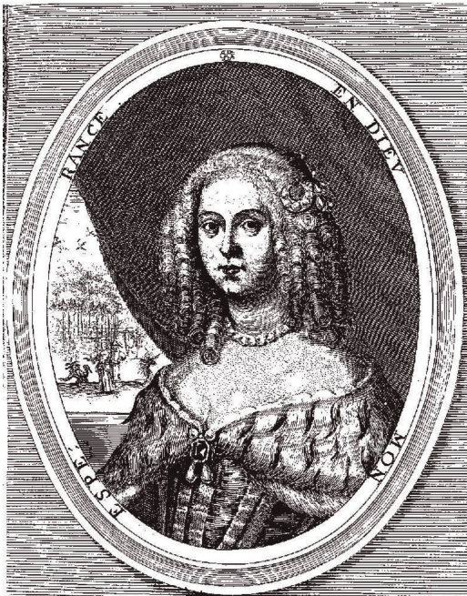
Ocios , 1660.