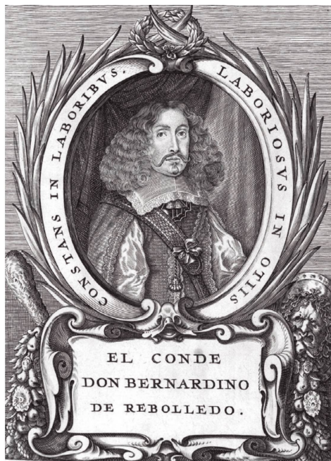
Selva militar , 1661.

Su representación iconográfica adopta los rasgos clásicos del medallón de raíz grecolatina y desarrollo humanista, adaptando la posición del torso y adoptando una disposición con ciertos aires de novedad. Su canonicidad, sin embargo, es evidente y queda demostrada por la adopción del modelo en los retratos incorporados por López de Sedano en su Parnaso español (1768-1778), con la adición bajo el busto del poeta de los instrumentos emblemáticos de su arte.