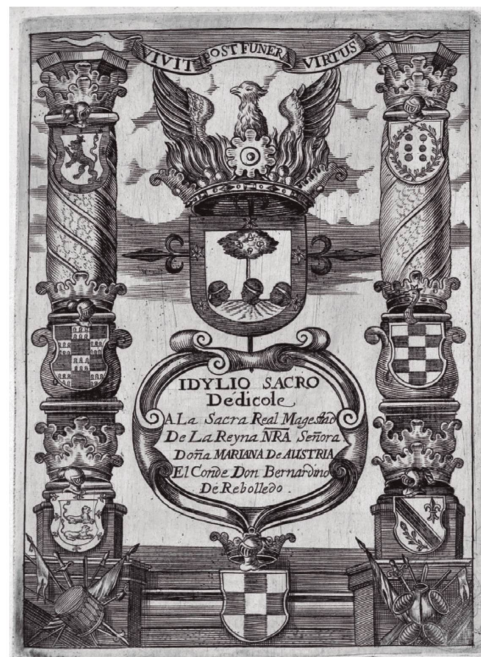
Idilio sacro , 1600.

La conexión de arte literario y axiología social ( Sociología de la literatura hispánica , 2018), extendida en el reinado de los Austria, adquiere una relevancia particular cuando el autor no procede del estamento más bajo, sino que ya participa, por su cuna, del aura aristocrática. En estos casos, como el que representa nuestro poeta (aunque el caso era más frecuente en los géneros doctrinales y religiosos, más frecuentados por segundones de la nobleza), el retrato personal alternaba posiciones en los preliminares del impreso con la referencia gráfica de su linaje, en forma del escudo de su casa. Dentro de la general tendencia de Rebolledo a la reduplicación, a la saturación de elementos auráticos, no resulta extraño que en sus páginas la alternancia ceda su lugar a la convivencia, doblando el elemento de prestigio del retrato con la impresión de su emblema nobiliario.