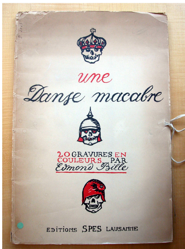
Fig. 3 : Edmond Bille, vignette de titre, zincographie en noir et rouge, (extrait de : une Danse macabre , Lausanne, Spes, 1919. Lausanne, BCUL), photographie de l'auteur

Avec la cessation de parution du journal fin 1917, Bille revient en force vers la pratique de la peinture, mais publie à ses frais un dernier recueil qui flamboie d'une lumière noire, une Danse macabre (fig. 3). C'est le recueil que