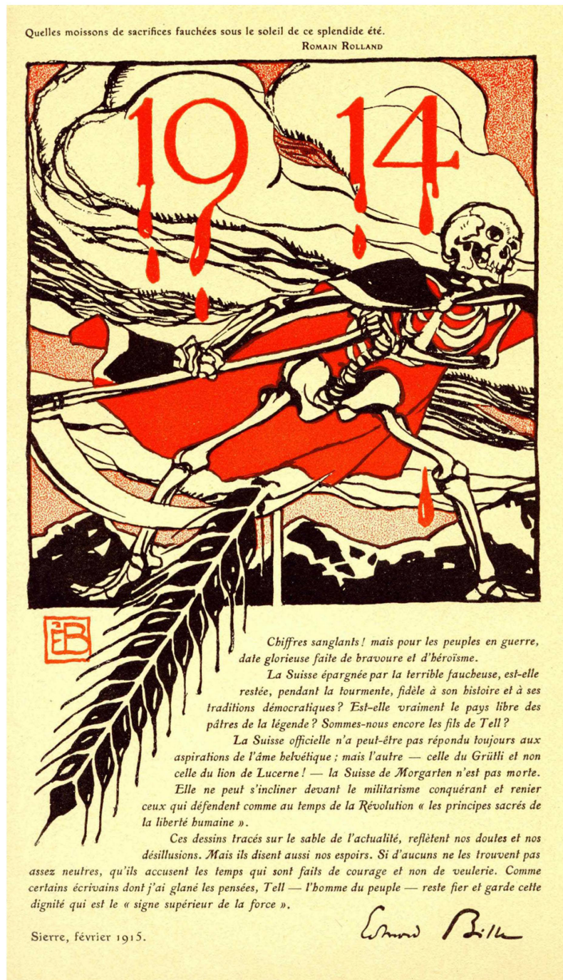
Fig. 2 : Edmond Bille, en-tête et préface, zincographie en rouge et en noir (extrait de : Au Pays de Tell , Lausanne, Payot, 1915. Lausanne, BCUL)

ainsi que l'une des grandes figures à venir de l'imagerie politique, le Belge Franz Masereel (1889-1972), auteur de plusieurs danses macabres, dont l'une paraît de manière fragmentaire dans la revue genevoise Les Tablettes .