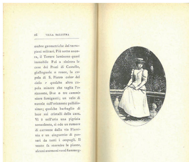
Fig. 4: Diego Angeli, Roma sentimentale , ed. 1900, prima pagina illustrata.