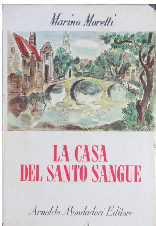
Fig. 1: Marino Moretti, La Casa del Santo Sangue (1930), copertina.

Govoni, e non ha motivo di resistere all'attrazione di Bruges 10 . Seguiranno, nella città fiamminga, una serie di ritorni e soggiorni anche prolungati. Al ritorno scrive su questa esperienza un libro curioso, La Casa del Santo Sangue , che pubblica nel 1929 a puntate sul supplemento del Corriere della Sera , anche allora intitolato «La Lettura», e l'anno seguente in volume appunto da Mondadori 11 . Il libro si legge a tutti gli effetti come un Bruges-la-Morte reloaded , effetto anche autoironicamente sottolineato (alla protagonista la «sotto-superiora, la vice Grande Dame» del Béguinage si rivolge a un certo punto sprezzante: «Ah, ah, voi siete un'intellettuale! avete letto i romanzi di Rodenbach! siete venuta per Rodenbach!» (Moretti 1930: 123-124)). Pure la copertina della prima edizione, seppur banalizzata dalle tinte pastello, replica l'immagine canonica, la « joli vue » del Minnewater che separa e congiunge la città «nuova» e mercantile all' hortus conclusus del Béguinage (scorcio nel libro di Rodenbach disegnato da Fernand Khnopff al frontespizio, e riprodotto fotograficamente all'inizio del primo capitolo):