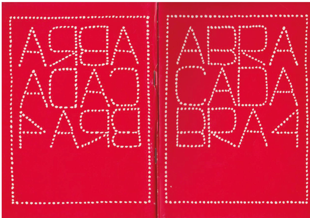
Fig. 2: Franco Beltrametti, ABRACADABRA , 4, 1979, copertina.

La parola 'abracadabra', oltre a essere il titolo della pubblicazione e una sorta di manifesto programmatico, con l'evolversi della rivista diventa punto di partenza per sperimentazioni linguistiche, grafiche e performative 14 . Il quarto numero si apre con un contributo di Guillaume Chpaltine che realizza un autoritratto dal titolo abracadabra selfportrait 1978 , dove posa davanti alla scritta «Abracadabra PALAZZO del MOBILE» coprendo con la testa la parola 'del' e stravolgendo quindi il significato dell'iscrizione, che diventa «Abracadabra PALAZZO MOBILE». La parola 'abracadabra' è stampata anche sulla busta, presumibilmente di plastica, che l'autore tiene tra le mani. In questo rapporto di ripetizione che collega titolo, iscrizione e scritta sulla busta, sembra rafforzarsi il valore performativo della formula: in un autoritratto magico 15 l'autore/illusionista sfida le leggi della fisica evocando un palazzo mobile.