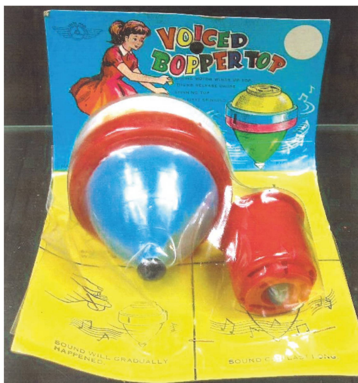
Fig. 1: Voiced Bopper Top , foto: dug4you, da Ebay.com.

Il capitolo LXXIX è una vera e propria mise en abyme di questo procedimento, presentando un readymade testuale, completamente enigmatico alla prima lettura. È tuttavia possibile identificarne gli elementi, cosa che permette di evidenziare il modus operandi di Sanguineti, svelando il loro significato poetologico. In un primo momento Sanguineti descrive quello che si rivela come la confezione di un giocattolo, una trottola musicale. Vi si vede una ragazza in abito rosso accanto al «titolo» perforato «VOICEDBOPPERTOP (V rosso, O giallo, I rosa, C rosso, E verde, D viola [...])» (1967: 168).