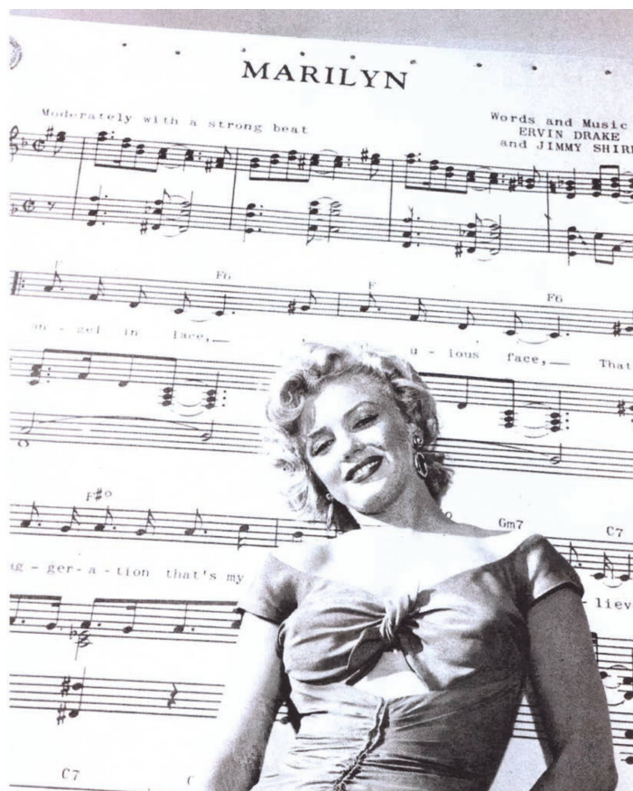
Fig. 3: Marilyn Monroe davanti allo spartito della canzone Marilyn .