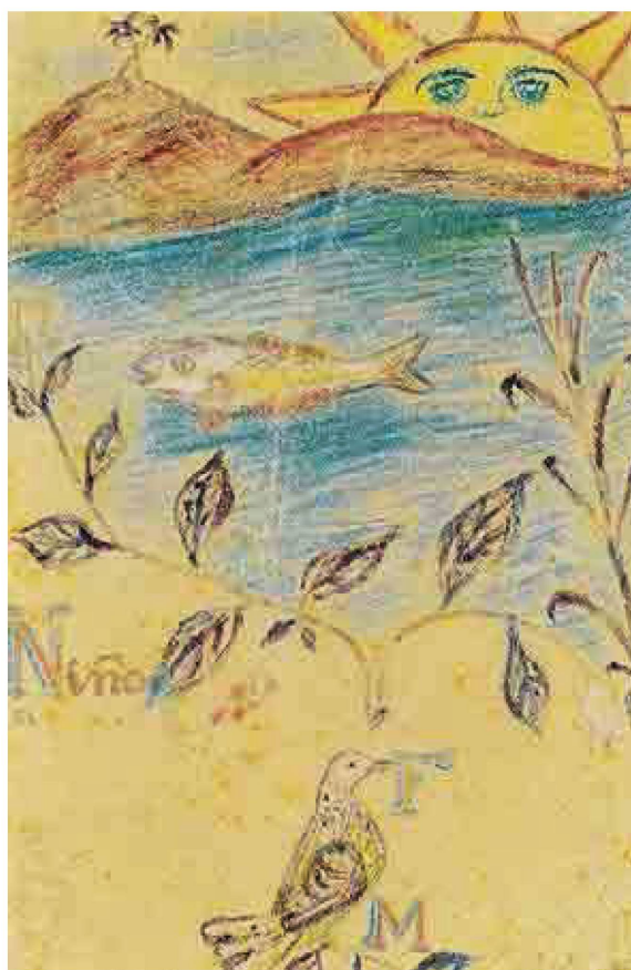
Fig. 1: Dibujo de Hernández sobre «El pez más viejo del río», enero de 1941.