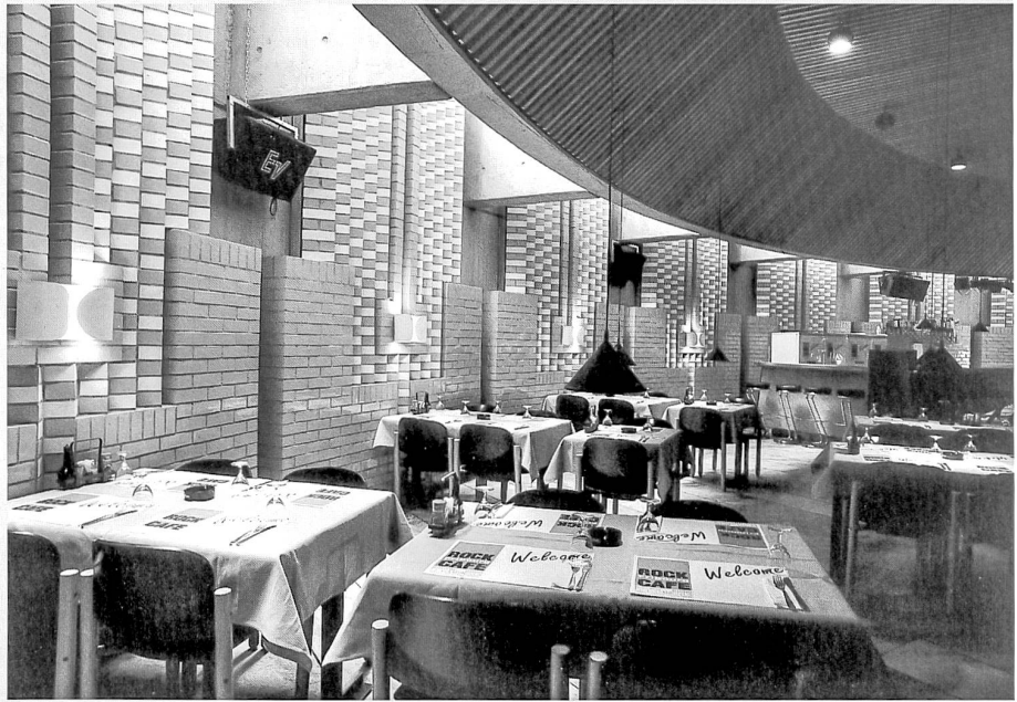
Le restaurant «Le Gambrinus» (actuellement «Rock Café»)

La banque a achevé sa mue en changeant d'enseigne. Ne dites plus «Banque de l'Etat de Fribourg». Depuis le 10 novembre 1996, l'établissement a récupéré le nom qu'il aurait dû porter dès l'origine: «Banque Cantonale de Fribourg». En 1892, les financiers helvétiques