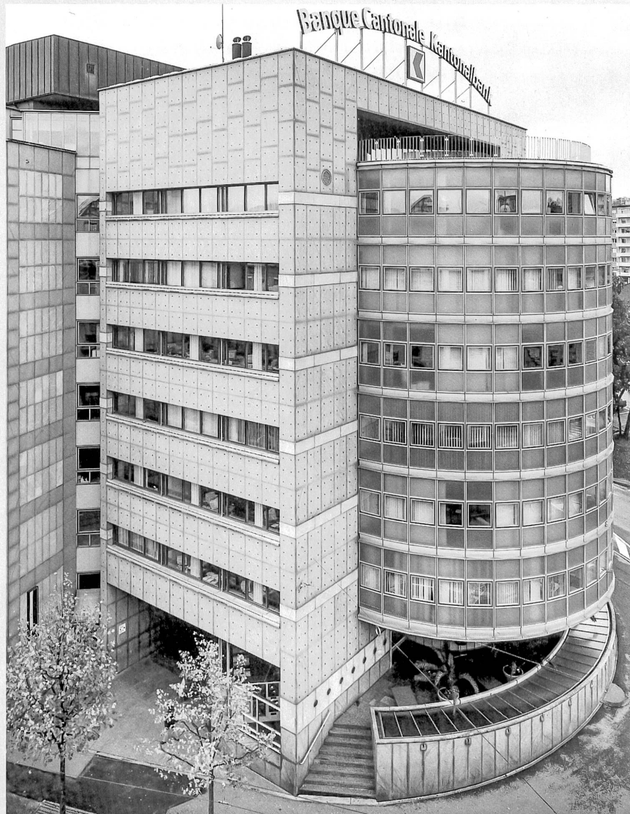
Tête du bâtiment et détail des fenêtres