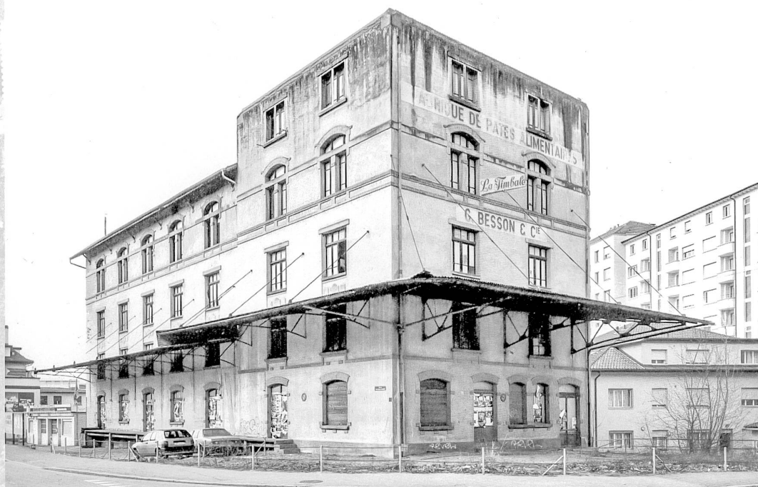
Bâtiment construit en 1904 sur les plans du bureau Broillet & Wulfleff de Fribourg, pour Grand & Cie, agrandi en 1913

Ancienne Minoterie de Pérolles puis Fabrique de pâtes «La Timbale»