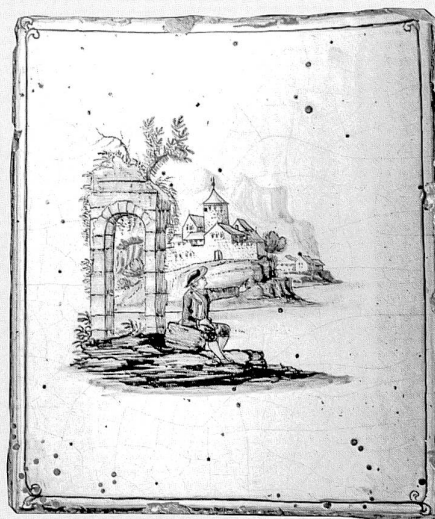
Carreaux d'un poêle provenant de la Samaritaine 9, dernier quart du XVIII e siècle, attribuable à l'atelier Nuoffer (propriété privée)

L'analyse menée dans la cave a permis la découverte d'un lot de 147 catelles provenant pour l'essentiel d'un seul poêle: pieds, catelles de plinthe, de corps, de raccordement et de corniche, toutes convexes ou plates, dessinant clairement le plan d'un poêle à corps quadrangulaire terminé par un demi-cercle (avec ou sans emmarchement?). Sa largeur peut être estimée entre 75 et 80 cm et sa hauteur à environ 160 cm pour un poêle comprenant cinq rangées de catelles de corps. Sa longueur reste difficile à estimer, car toutes les catelles n'ont pas été jetées au même endroit et celle-ci dépend de l'emplacement du poêle, mais aussi des moyens de ses commanditaires. Le solde de ces catelles, datant de la seconde moitié du XVIII e siècle, provenaient d'au moins deux autres poêles.