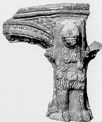
Catelles de pied, de plinthe, de raccordement, de corps et de corniche, XVII e siècle