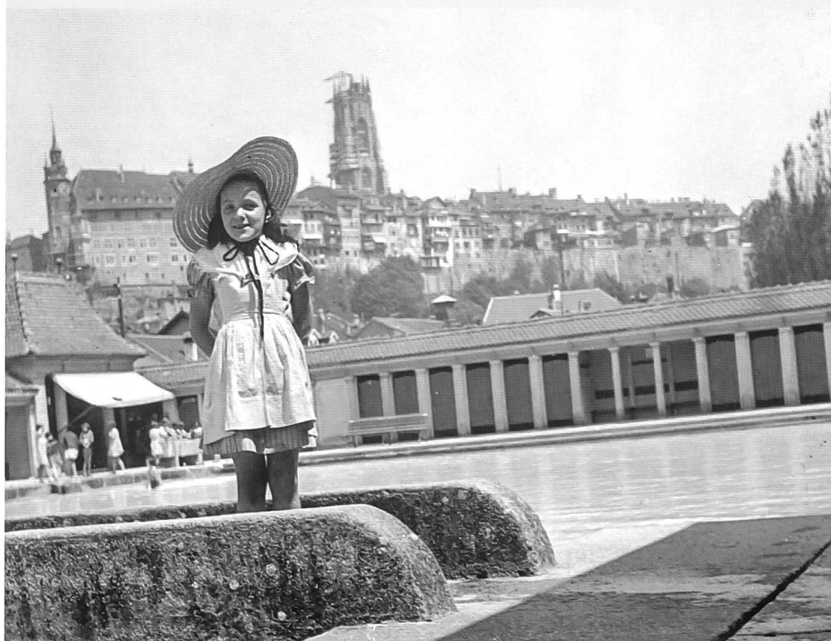
Pose à l'entrée de la passerelle de la Motta, en 1939

soleuroise. A Fribourg comme à Burgdorf, l'ingénieur s'est effacé derrière les architectes. Mais à Adelboden, à Wengen et surtout à Heiden où il obtint l'ensemble du mandat,