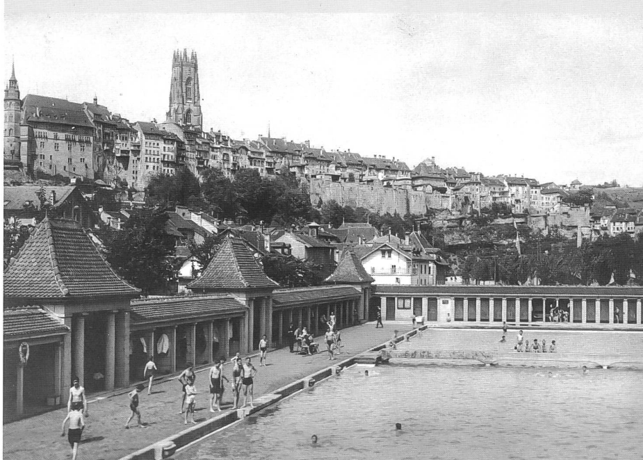
Jour d'été à la Motta avant 1947, avec la passerelle séparant grand et petit bassin (carte postale, ASBC)

Si la volonté d'intégration au site justifie le parti Heimatstil des architectes, la réalisation et les installations témoignent de l'esprit moderne qui soufflait alors sur Fribourg où les entrepreneurs emmenés par quelques ingénieurs