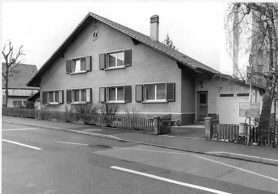
Route du Champ-des-Fontaines 12-14, côté rue