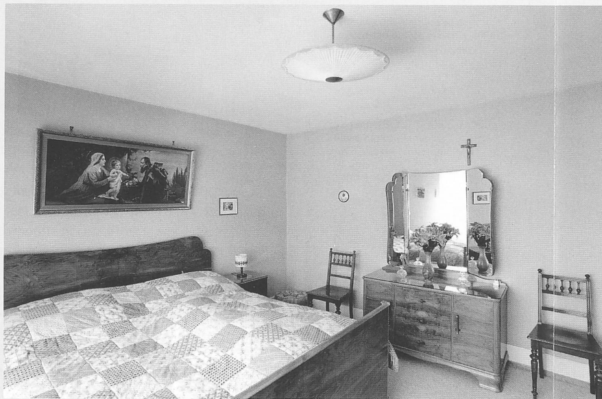
Chambre à coucher avec lit, table de nuit et commode réalisés par le menuisier Hermann Sauter, locataire d'un appartement de la route de la Broye depuis 1956

Avec une moyenne de près de 12 habitants par maison en 1888, la ville de Fribourg connaissait les pires conditions de logement de toute la Suisse. L'Age, avec ses 2,67 habitants par pièce, détenait un triste record de densité et d'insalubrité. L'extension de la ville et la création de quartiers périphériques dans les années 1900 avaient répondu principalement à une demande d'immeubles résidentiels à l'intention d'une nouvelle bourgeoisie de commerçants et d'enseignants. Dans les années 1920, les initiatives de la Fédération ouvrière fribourgeoise, fondée en 1906, et de La Fraternelle étaient bien trop modestes pour répondre aux besoins 1 . Durant la Seconde Guerre mondiale, quelque 140 ménages s'installèrent chaque année en ville alors qu'on ne construisait que 60 appartements par an.