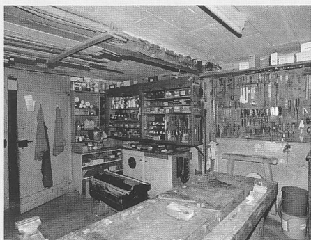
L'atelier, près de la cave à provisions, une fonction commune aux logements d'ouvrier

l'assemblée refusa l'avant-projet présenté en novembre 1944. «Devant de nombreuses demandes pour la construction de maisons familiales», le président de La Solidarité, René Mauroux chargea l'architecte Louis Vaucher, un socialiste, d'établir un nouveau projet qui fut présenté à l'assemblée générale du 14 mars 1945. Malgré l'intervention de Charles Meuwly qui militait en faveur de la construction de blocs, plus rentables et permettant des loyers plus bas 9 , on choisit de réaliser des maisons familiales, en prenant pour modèle les maisons jumelées du quartier de Lerchenfeld à Thoune, dont le mandat avait été confié en 1941 à l'architecte Edgar Schweizer (1895-1977), 3 e prix ex aequo du fameux concours de maisons familiales bon marché lancé en 1934 par l'Association suisse pour l'habitat (Schweizerischer Verband für Wohnungswesen und Wohnungsreform) 10 .