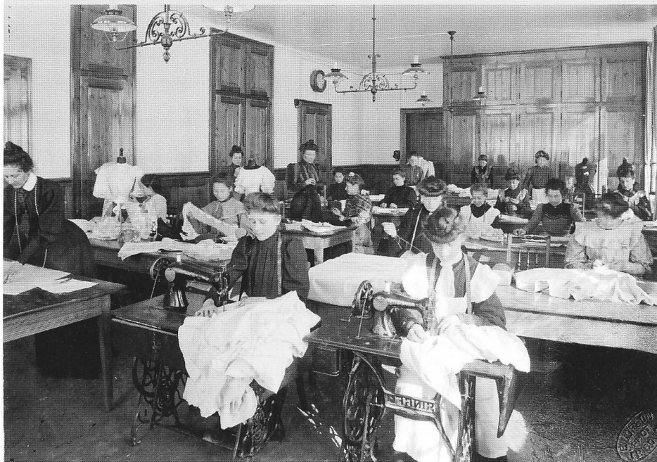
Atelier des apprenties lingères, confectionnant des jupons de dessous et des chemises de nuit