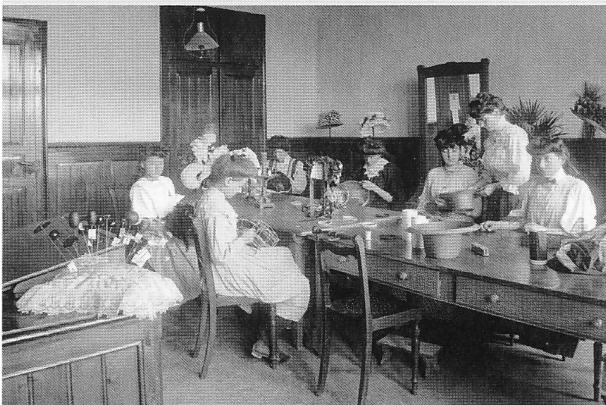
Atelier des apprenties modistes, confectionnant des chapeaux de dentelle et des barettes

M r Jean Quartenoud (1859-1938), l'école secondaire des filles tente de combler cette brèche en proposant quatre filières de formation. L'école de coupe et de couture, ouverte en 1894, formera en trois ans des professionnelles de la robe et de la jaquette, de la redingote et du manteau. Brassières, robes de nuit, chemises d'hommes, camisoles, jupons, tabliers ou vareuses sont au programme de l'école de lingerie dès 1901. Le nouveau bâtiment de Gambach permit l'ouverture en 1905 d'une école de cuisine professionnelle, où les futures cuisinières ou maîtresses de maison passaient en une année des fourneaux à la table. Elle assurait également la formation obligatoire des élèves de l'école secondaire. En 1906 enfin, une école de modes compléta l'offre.