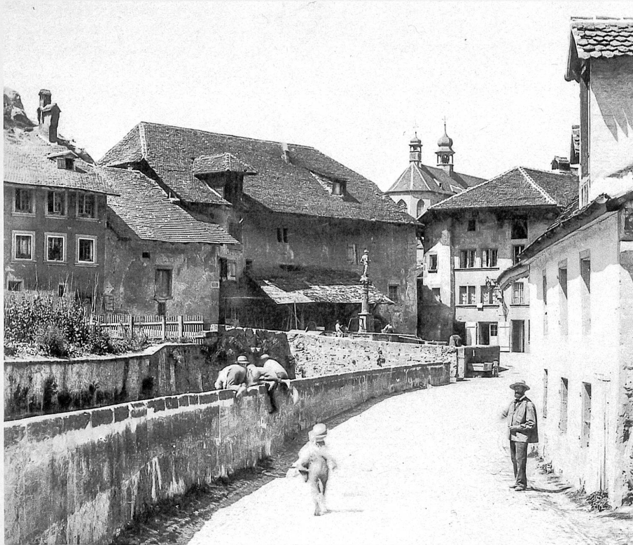
Vue de la porte du Gottéron, la maison Mooses et sa grange-écurie dans les années 1880-1890

«Celui qui visite les habitations du quartier de l'Auge est bien étonné parfois d'y découvrir des pièces d'une dimension qu'atteignent à peine celles des vastes appartements modernes. Les ornements en stuc des plafonds, noircis par le temps, les boiseries richement sculptées dissimulées sous le crépi, la belle ornementation gothique qui se retrouve à la façade extérieure des maisons, témoignage des gloires passées, s'harmonisant peu, hélas! avec les escaliers vermoulus et les débouchés des nombreux logements pratiqués dans les vastes vestibules de la maison d'autrefois. Et ce qui s'accorde