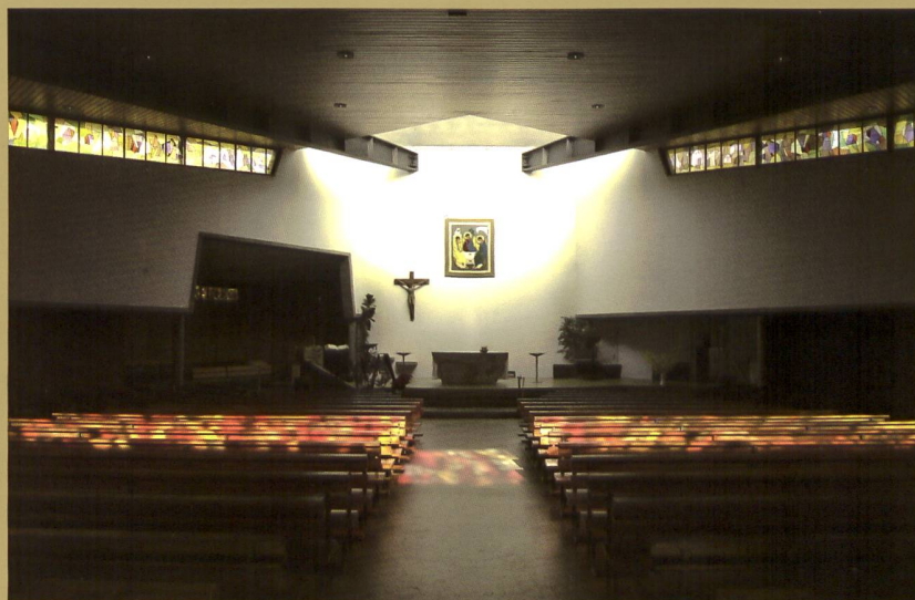
LA CHAPELLE DE SEMAINE OUVERTE SUR LA NEF AVEC LES ŒUVRES DE YOKI, DALLES DE VERRE (1965), CHEMIN DE CROIX PEINT (1973) ET VERRIÈRES ABSTRAITES (1992)

MIS À PART SON EMMARCHEMENT DE BASALTINE ET SON CHEVET BAIGNÉ DE LUMIÈRE, LE CHŒUR SE FOND DANS L'ESPACE DE LA NEF. LES TRADITIONNELS BAS-CÔTÉS ONT DISPARU PERMETTANT L'AMÉNAGEMENT DE LA CHAPELLE BAPTISMALE ET DE LA SCÈNE DES CHANTRES D'UN CÔTÉ, DE LA CHAPELLE DE SEMAINE DE L'AUTRE