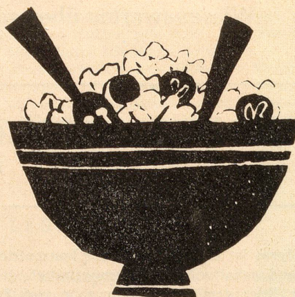
Thomy + Franck AG Basel