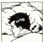
Falsche Kopflage: mit gewöhnlichem Kissen

Wenn Sie auf dem Bauch schlafen wollen, können Sie es jetzt, ohne den Hals zu verdrehen, und dabei erst noch freier atmen . Schlafen Sie auf dem Rücken, so haben Sie beste Gewähr, nicht mehr zu schnarchen . Und zugleich können Sie die Bildung eines Doppelkinns verhindern . Schlafen Sie seitlich, so ruhen Kopf und Nacken in der anatomisch richtigen Lage .