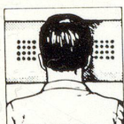
Richtige Kopflage: mit HOLLYBED