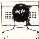
Richtige Kopflage: mit HOLLYBED