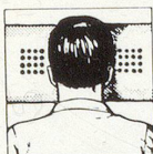
Richtige Kopflage: mit HOLLYBED