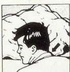
Falsche Kopflage: mit gewöhnlichem Kissen

Wenn Sie auf dem Bauch schlafen wollen, können Sie es jetzt, ohne den Hals zu verdrehen, und dabei erst noch freier atmen . Schlafen Sie auf dem Rücken, so haben Sie beste Gewähr, nicht mehr zu schnarchen . Und zugleich können Sie die Bildung eines Doppelkinns verhindern . Schlafen Sie seitlich, so ruhen Kopf und Nacken in der anatomisch richtigen Lage . Keine Falten graben sich mehr in Ihr Gesicht, und die Frisur wird geschont , so dass Sie am Morgen später aufstehen können. Mit der morgendlichen Müdigkeit ist es vorbei, denn Hollybed bringt über Nacht Entspannung.