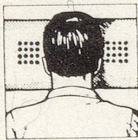
Richtige Kopflage: mit HOLLYBED