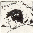
Falsche Kopflage: mit gewöhnlichem Kissen

Wenn Sie auf dem Bauch schlafen wollen, können Sie es jetzt, ohne den Hals zu verdrehen, und dabei erst noch freier atmen . Schlafen Sie auf dem Rücken, so haben Sie beste Gewähr, nicht mehr zu schnarchen . Und zugleich können Sie die Bildung eines Doppelkinns verhindern . Schlafen Sie seitlich, so ruhen Kopf und Nacken in der anatomisch richtigen Lage .