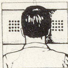
Richtige Kopflage: mit HOLLYBED