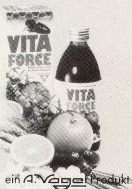
ein A. Vogel Produkt

In der BR Deutschland unter dem Namen A. Vogels Vital-Extrakt im Handel