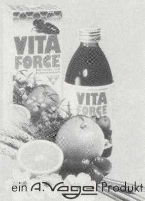
ein A. Vogel Produkt