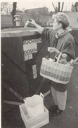
Altglas und Weissblech gehören in eine Sammelstelle, und nicht in den Kehrtrichtersack.

Abfall vermeiden ist das beste Mittel gegen den Abfallberg. Daher ist es besser, Kleider zu flicken und Spielsachen zu reparieren als neue Produkte zu kaufen und die alten wegzuworfen. Die Weiterverwendung von Gegenständen über Brockenhäuser, Kleiderbörsen, Kleidersammlungen, Flohmärkte, Buchantiquariate oder durch Inserate in Quartierläden oder Zeitungen ist in jedem Fall der einfa-