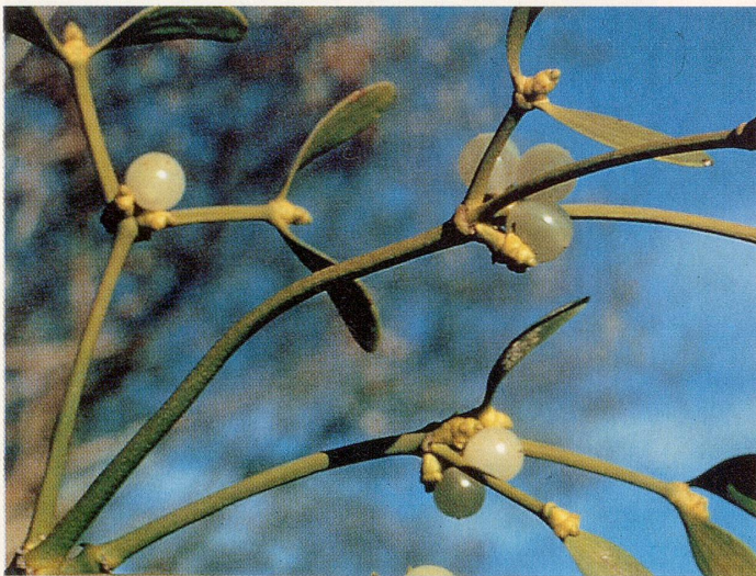
Die Mistel bewirkt eine bessere Funktion des Zellstoffwechsels.

Heute erkrankt in Europa jeder Dritte an Krebs. Dies obwohl jährlich Millionenbeträge in die Krebsforschung gesteckt werden. Was bedeutet diese vernichtende Diagnose Krebs wirklich, warum gibt es nur wenige erfolgreiche Behandlungen, und was kann man biologisch gegen diese Krankheit tun?