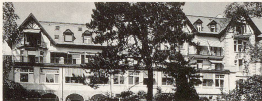
Gesundheitswochen in der Privatklinik Bircher-Benner Zürich

Die Privatklinik Bircher-Benner, in einem Park an schönster Aussichtslage am Zürichberg gelegen, bietet vier verschiedene Typen von (Gesundheitswochen) mit kulturellem Beiprogramm an, in denen – ausgerichtet auf die persönlichen Bedürfnisse – gesünderes Leben durch Umstellung der Lebensgewohnheiten, natürliche Heilverfahren und richtige Ernährung erlernt und erfahren werden können. Biologisch-medizinische Fachärzte betreuen die Gäste während ihres Aufenthaltes in der Kurabteilung der Privatklinik Bircher-Benner.