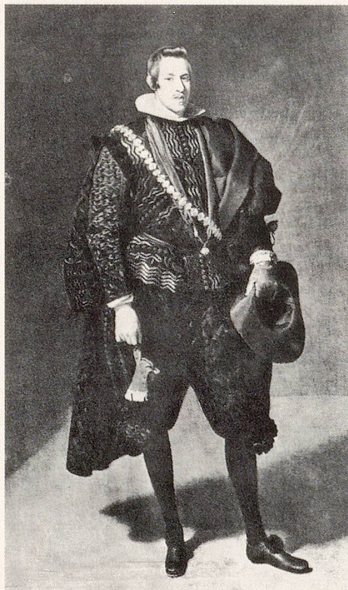
Buchtipp: Paul Weber: Schuhe, Drei Jahrtausende in Bildern, AT Verlag, CH-5001 Aarau

Heute gibt es viel weniger Diktate in der (Schuh-)Mode als zu früheren Zeiten. Der Obrigkeit ist es egal, welche Schuhe die Untertanen tragen. Jeder ist selbst verantwortlich für seine Fuß-Gesundheit. Die Auswahl ist heute größer als je zuvor, man bekommt nicht nur für jede Sportart, für Stadt, Land, Fluß und Berg den passenden