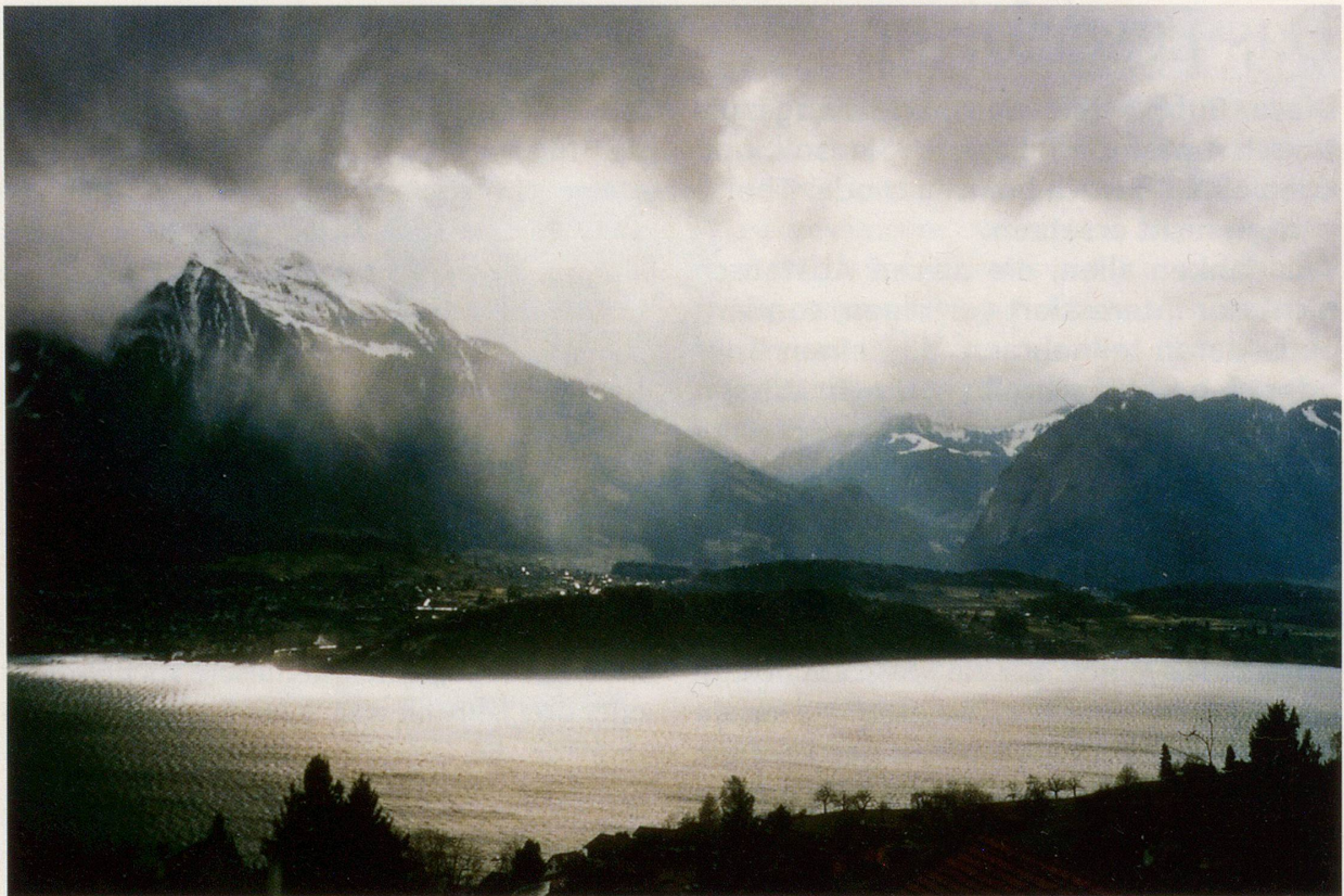
LESERFORUM-GALERIE - DAS LESERFOTO IM JUNI